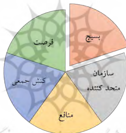
الگوی شماره ۲: مدل بسیج

۵- فرصت. مقصود تیلی از فرصت رابطه میان منابع یک جمعیت و شرایطی که جمعیت مذکور در پیرامون خود می‌یابد است (Tilly, 1978: 55). فرصت (یعنی رابطه میان منافع جمعیت و وضعیت موجود جهان پیرامون) که شامل عناصر قدرت، سرکوب و فرصت یا تهدید یعنی میزان آسیب‌پذیری حکومت و سایر گروه‌ها به دعوای تازه و تهدید نسبت به دعوایی که در صورت توفیق، تحقق منافع مدعی را کاهش می‌دهند است (تیلی، ۱۳۸۵: ۸۶؛ مشیرزاده، ۱۳۸۱: ۱۵۳-۱۵۲). در واقع رفتار هر مدعی در این مدل با این پنج ویژگی مشخص می‌شود.