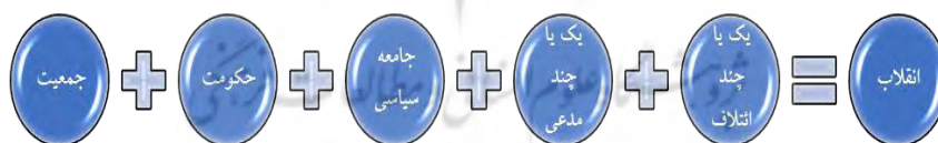
الگوی شماره ۱: الگوی سیاسی

مدعیان در الگوی تیلی به گروه‌هایی گفته می‌شود که در دوره‌های خاصی منابع جمعی خود را در جهت نفوذ بر دولت به کار می‌گیرند. یکی از گروه‌های مدعی معمولاً عضو دستگاه سیاسی است، یا به عبارت دیگر دسترسی به قدرت حاکم دارد. تیلی این گروه را «مدعی عضو» نام‌گذاری کرده است. طرف دیگر، گروه چالش‌گر نامیده می‌شود. در حالی که گروه متصل به دستگاه سیاسی، یا مدعی عضو، دسترسی بی‌دردسر و کم هزینه به منابع دولتی دارد، چالش‌گران کاملاً بیرون از دستگاه سیاسی قرار دارند و دستیابی به منابع تحت تسلط دولت برایشان به سهولت مقدور نیست. مدعیان (اعم از گروه‌های عضو و چالشگر) برای پیشبرد خواسته‌های خود، به «ائتلاف» با سایر گروه‌ها دست می‌زنند، و می‌کوشند تا عمل جمعی خود را با سایر متحدین بالقوه هماهنگ سازند (سیدامامی، ۱۳۷۴: ۱۵۹). به باور تیلی، رقابت اصلی و منشا پویایی ناشی از رقابتی است که میان عناصر الگوی سیاسی قرار دارد، و این رقابت موجب انقلاب می‌شود.