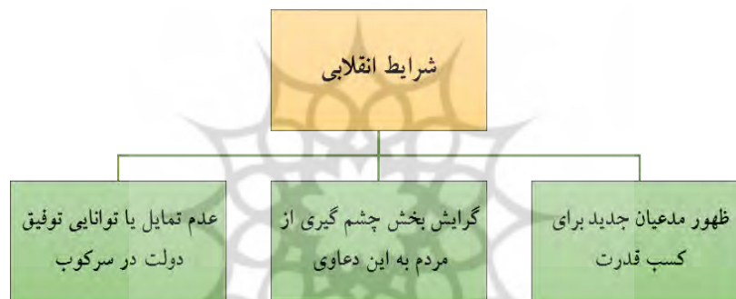
الگوی شماره ۳: شرایط انقلابی

۱- مدعیان یا ائتلاف‌های چند مدعی جدید در صحنه سیاسی ظهور می‌کنند و این مدعیان سعی می‌کنند، ادعاهای خود مبنی بر تسلط بر دولت را محقق کنند. ۲- بخش قابل توجهی از جمعیت به ادعاهای مطرح شده از سوی گروه‌ها همراه و متعهد می‌شوند. این افراد به رغم ممنوعیت‌ها و تهدیدهایی که متوجه آنها است، شروع به فعالیت جمعی می‌کند. ۳) نیروهای نظامی دولت حاضر به سرکوب مدعیان جدید قدرت نمی‌شوند، یا اصولاً در سرکوب مدعیان ناتوان می‌مانند (Tilly, 1978: 195) این علامت‌ها ممکن است با شرایطی در ارتباط باشند که دیگر تحلیل‌ها، آنها را به عنوان شتاب‌دهنده‌های انقلاب مطرح می‌کنند: نارضایتی روزافزون، تعارض ارزش‌ها، ناکامی و یا محرومیت نسبی (تیلی، ۱۳۸۵: ۲۸۷).