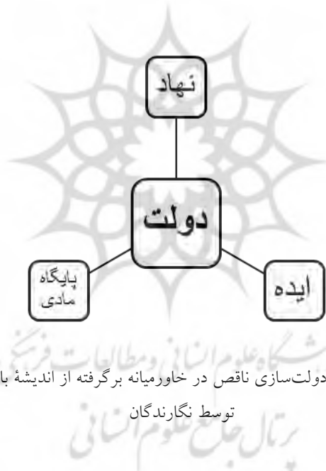
شکل ۳- مدل مفهومی دولت‌سازی ناقص در خاورمیانه برگرفته از اندیشه باری بوزان، ترسیم توسط نگارندگان

که باعث شده تا آنها قافیه را به ایدئولوژی‌ها و «استراتژی‌های بقای» رقیب در گوشه و کنار کشور همانند ناسیونالیسم قومی کردی در عراق و سوریه، اخوانیسم، داعشیسم، تکفیریسم و... ببازند و به ناچار برای تضمین بقاء و حیات خویش استفاده هرچه بیشتر از نیروی نظامی، امنیتی و پلیسی را در دستورکار قرار دهند و بدین صورت علاوه بر مبدل شدن به عامل تهدید برای مردم، زمینه ساز معمای مشروعیت در داخل کشور شوند. به عنوان نمونه می‌توان به عملکرد ضعیف رژیم حاکم بر سوریه در دفاع از دمشق در جریان جنگ ۱۹۶۷ با اسرائیل اشاره کرد که تا حد زیادی از مشروعیت ناسیونالیستی آن کاست. از دست دادن بلندی‌های جولان سرزنشی دائمی برای حزب حاکم ایجاد نمود و شرایط را برای چالش دولت آماده کرد (نبوی و دری، ۱۳۹۶: ۱۱۰).