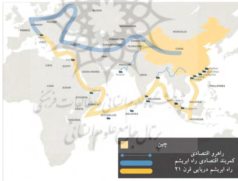
تصویر شماره ۱. ابتکار کمربند و راه چین

در سال ۲۰۱۳ شی جین پینگ تمایل به ایجاد ابتکار یک کمربند یک راه را جهت احیا راه ابریشم باستانی، با در اولویت قرار دادن زیرساخت و ارتباطات مطرح کرد. [چین به دلیل سوء تفسیر از نام این ابتکار مخصوصاً از «یک» کمربند یک راه، در سال ۲۰۱۶ عنوان آن را به ابتکار کمربند و راه تغییر داد]. شی جین پینگ این ابتکار را در دانشگاه نظریات فزاقستان اعلام کرد (Reeves & et al, 2017: 63).