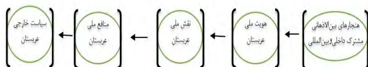
نمودار ۱- مدل سیاست خارجی عربستان برگرفته از مدل کلی سیاست خارجی دکتر دهقانی فیروزآبادی

این نظریه یکی از نظریه‌های مهم روابط بین‌الملل است که در آن تلاش می‌شود مسائل عمده سیاست بین‌الملل از جمله سیاست خارجی کشورها بررسی شود. در این مقاله به بررسی سیاست خارجی عربستان در قالب دیپلماسی عمومی پرداخته شده است. این کشور در صدد است تا با برقراری روابط دیپلماتیک با دیگر کشورها به منافع ملی خود دست یابد که رسیدن به منافع ملی باعث تحقق سیاست خارجی آن می‌شود و برای این کار از هویت و فرهنگ خود استفاده می‌کند.