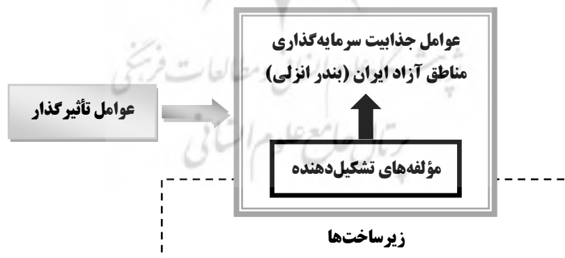
شکل شماره ۲. الگوی نظری پژوهش

با توجه به ادبیات موجود در زمینه جذابیت بازار مناطق آزاد، می‌توان به این نکته اشاره کرد که هنوز روش‌های ارزیابی جذابیت بازار، کامل و جامع نیستند و با مروری بر تجارب گذشته مشاهده می‌شود که متغیرهای لحاظ شده در بررسی جذابیت‌های بازار به مرور زمان جامع‌تر و ابعاد مختلف آن دیده می‌شود. از این رو شناسایی ابعاد جذابیت در این مطالعه بر اساس مطالعه کیفی صورت گرفته است. با بررسی ادبیات و سوابق مطالعاتی مرتبط با موضوع، به کمک نتایج حاصل از بررسی ادبیات تحقیق الگوی زیر به‌عنوان الگوی نظری تحقیق ارائه شده است.