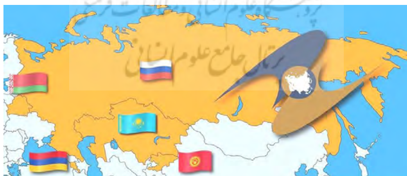
شکل شماره ۱. کشورهای عضو اتحادیه اقتصادی اوراسیا قبل از پیوست ایران

سایر جمهوری‌های مشترک المنافع با نگاه به تجربه مثبت و مفید این اتحادیه، جهت بهره‌برداری از منافع و فواید آن متمایل به عضویت در این اتحادیه شدند و در سال ۲۰۱۵ با درخواست عضویت کامل دو کشور ارمنستان و قرقیزستان در سال ۲۰۱۵، تعداد اعضای آن را به ۵ عضو ارتقاء یافت. توسعه اتحادیه اقتصادی اوراسیا با وضعیت اقتصاد اعضا رابطه مستقیم دارد. از سوی دیگر همگرایی با شرکای خارجی برای دستیابی به دستاوردهای بیشتر در اولویت اعضا قرار گرفته است. اما از آنجاکه اعضای اتحادیه، اقتصاد توسعه یافته‌ای ندارند، سیاست‌های مختلفی در این اتحادیه برای گسترش روابط اقتصادی استفاده شده است. ایجاد منطقه آزاد تجاری با سایر کشورهایی که دارای اقتصاد در حال توسعه و باثبات هستند و نیز ایجاد سازوکار همکاری با اتحادیه‌های منطقه‌ای (مثل اتحادیه اروپا و آسه‌آن)، از جمله سیاست‌های اقتصادی این اتحادیه در دستیابی به هدف خود است (خان-محمدی، ۱۳۹۸).