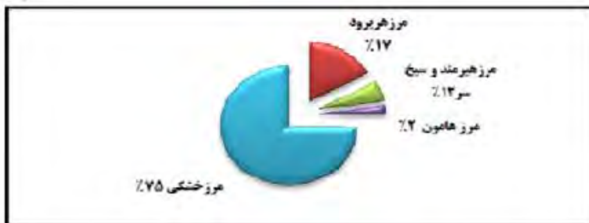
نقشه شماره 9. طول و نوع مرزهای ایران و افغانستان