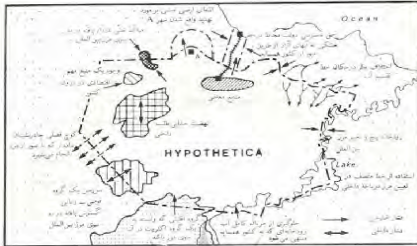
جدول شماره 2. فرصت‌های ایران در مرزهای هم‌جواری با افغانستان