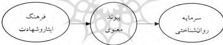
شکل ۱. الگوی نظری و مفهومی پژوهش از رابطه فرهنگ ایثار و شهادت با پیوند معنوی و سرمایه روان‌شناختی

شکل (۱)، از آنجایی که فرهنگ ایثار و شهادت زمینه‌ساز رضایت از خود، زندگی و محیط اطراف می‌شود. در این پژوهش چنین فرض شده که در گام اول فرهنگ ایثار و شهادت باعث تقویت پیوند معنوی و سپس پیوند معنوی نیز زمینه‌ساز تقویت سرمایه روان‌شناختی برقراری خود کارآمدی، امیدواری، تاب‌آوری و خوش‌بینی در زندگی کاری کارکنان می‌شود. مدل ارائه‌شده در این پژوهش، مدلی است که بر مبنای نوعی رویکرد مثبت نگری معنوی تدوین شده است. به این معنی که فرهنگ ایثار و شهادت به‌عنوان یک شاخصه معنوی به‌صورت بالقوه عاملی بسیار نیرومند برای تقویت سازه‌های مثبت نگر نظیر پیوند معنوی و سپس سرمایه روان‌شناختی است. این رویکرد در پژوهش‌ها و نظریات مطرح‌شده (گل پرور ۱۳۹۳، سیاوش شیخ‌علی‌زاده و همکاران ۱۳۹۹) درباره کارکردهای معنویت مورد توجه قرار گرفته است. در جمع‌بندی پایانی باید گفت که چون پیوند معنوی و سرمایه روان‌شناختی، از پدیده‌هایی محسوب می‌شوند که برای کارکنان اداری و ارباب‌رجوع از اهمیت بسزایی برخوردارند، لازم است کماکان پژوهش در عرصه همبسته‌های این دو پدیده ادامه یابد.