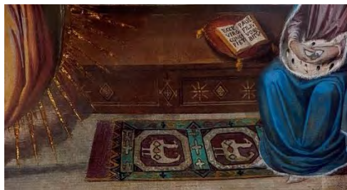
تصویر ۱. هنرمند ناشناس، لحظه بشارت (بخشی از اثر)، نقاشی دیواری، فلورانس، باسیلیکای سنتیسیما آنونزیاتا، قرن چهاردهم-پانزدهم میلادی..

در قرن پانزدهم میلادی و همزمان با درخشش شهر فلورانس و تبدیل شدنش به یکی از مهم‌ترین مراکز هنری کشور ایتالیا، نمایش اشیاء اسلامی در آثار هنرمندان این شهر - خصوصاً نقاشی - اهمیت ویژه‌ای یافت. اولین تلاش هنرمندان برای پیوستن به این جنبش با بازآفرینی تصاویر فرش در نقاشی شروع شد (سریشاری، ۲۰۰۴: ۳۳۵). قدیمی‌ترین اثری با این مضمون که در دست است، نقاشی دیواری «لحظه بشارت» از هنرمندی ناشناس است که امروزه در یکی از باسیلیکاهای ۱ شهر فلورانس قرار دارد (تصویر ۱).