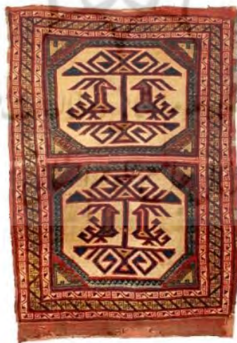
تصویر ۲. فرش ماربی پیدا شده در کشور سوئد، قرن ۱۴-۱۶ میلادی، استکهلم، موزه ملی عتیقه‌جات. شماره: SHM17786.

شکی نیست که این فرش الهام گرفته شده و برداشتی نوین از یکی از فرش‌های موسوم به «ماربی» است. این مدل فرش در جغرافیای آناتولی تحت سلطه سلجوقیان و عثمانیان - قرن چهاردهم تا شانزدهم میلادی - بافته می‌شد (فرانسس، ۲۰۱۳: ۲۶۰). این مدل فرش دارای دسته بندی‌های متفاوتی از دیدگاه طراحی است اما معروف‌ترین آن، نقوش حیوانی است که یکی از قدیمی‌ترین نمونه‌های آن در سال ۱۹۲۵ میلادی در کلیسای متروکه ماربی در کشور سوئد پیدا شد و به همین خاطر به همین نام معروف شد (ویگت، ۲۰۲۲: ۴). این مدل دارای قاب‌های هشت ضلعی است که در هر قاب نقش پرندگان روبه‌روی یکدیگر قرار دارند که بین آن‌ها درخت زندگی نمایش داده شده است (تصویر ۲).