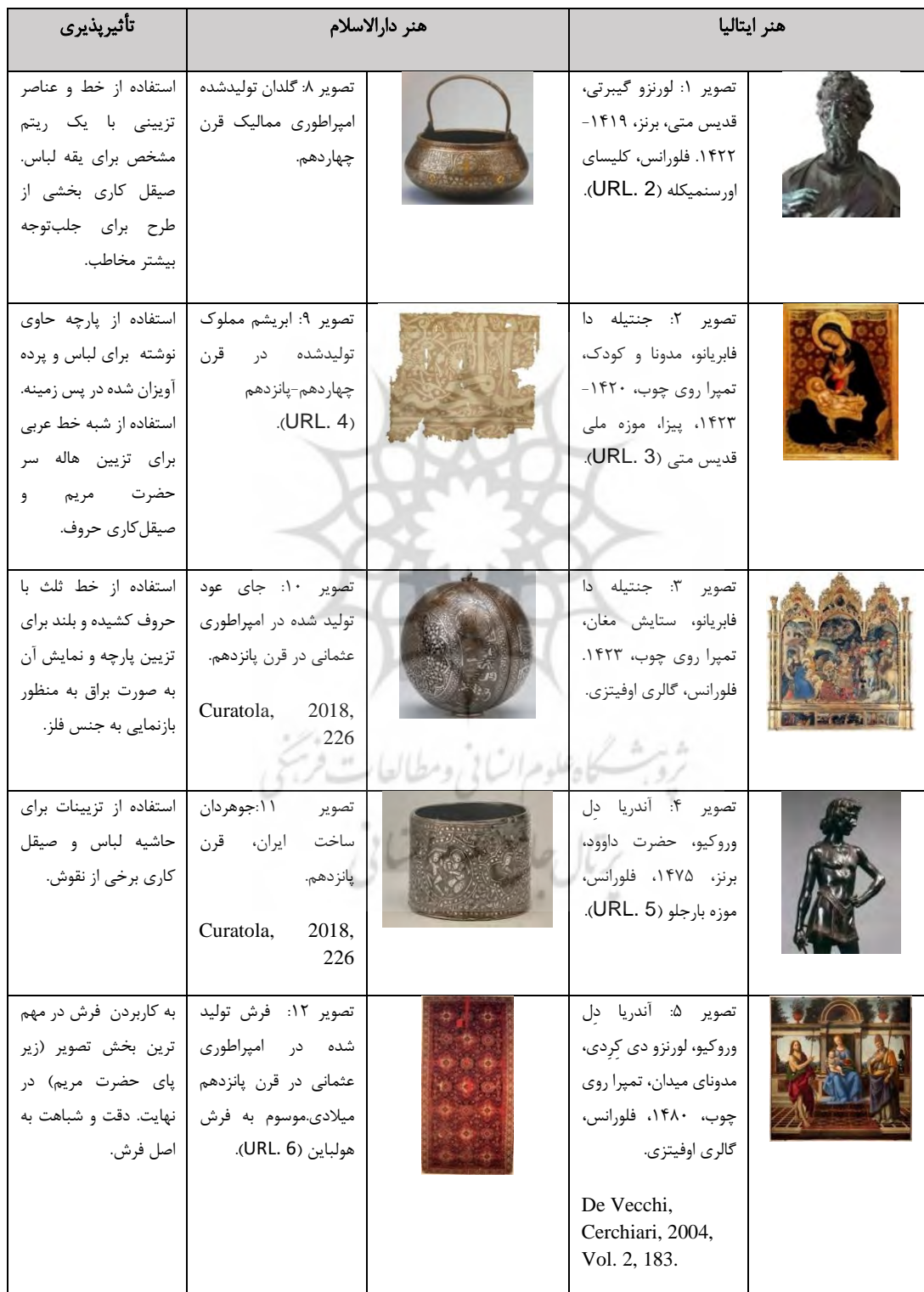
جدول ۱. تحلیل آثار نمودار ۱ از حیث تأثیرپذیری بصری

نمودار ۱. تطبیق زمانی مهم‌ترین امپراطوری‌های دارالسلام و سلسله مدیچی به همراه آثار معرف جنبش «به سبک شرقی» در توسکانی و منبع الهام‌گیری بصری