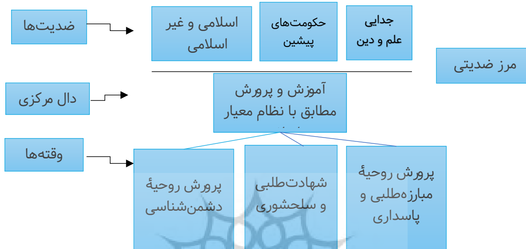
نمودار ۱. چهارچوب مفصل‌بندی گفتمان کتب درسی در دوره اصلاحات

قوانین اسلامی در مقابل طرد گفتمان‌های غیر اسلامی و همچنین تقابل جمهوری اسلامی در مقابل تمامی حکومت‌های پیشین و ارائه الگوهای دینی با غیریت جدایی علم و دین مرزهای ضدیتی برای این