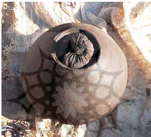
عکس ۱۱- بوکله در پایان اندود کردن قالب.

پس از خارج نمودن کیسه پارچه‌ای، درون ظرف را به وسیله اندودی از جنس بدنه می‌پوشانند، تا علاوه بر، برطرف نمودن رد پارچه، داخل ظرف همانند بیرون آن صیقلی گردد. هم‌زمان با صیقلی نمودن درون ظرف، برای آن، دری از چوب می‌تراشند و همانند دسته‌ها، اندود می‌نمایند. (عکس ۱۱) سپس ظرف را به مدت یک هفته دیگر در معرض هوای آزاد قرار می‌دهند تا کاملاً خشک و سخت گردد. (عکس ۱۲)