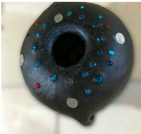
عکس ۹- تزئینات بوکله.

بعد از کامل شدن تمامی مراحل، ظرف را در همان حالت آویزان، به مدت یک هفته در معرض نور آفتاب قرار می‌دهند، تا کاملاً خشک گردد. با گذشت حدود یک هفته، بدنه ظرف همانند سنگ سخت می‌گردد. در این هنگام ظرف را از محل خود پایین آورده و پس از باز کردن قالب پارچه‌ای، خاک درون قالب را تخلیه و به آرامی کیسه خالی شده از خاک را از داخل ظرف جدا نموده و آن را خارج می‌نمایند. (عکس ۱۰)