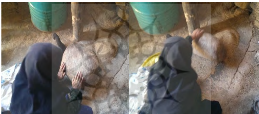
عکس های ۴ و ۵- آسیاب ریشه خشک شده لوه.

سپس ریشه‌های خشک شده را به وسیله آسیاب سنگی (برده‌ر) خرد می‌نمایند. (عکس ۴ و ۵) پس از آسیاب نمودن ریشه‌ها، را بر درون مدور و مقعر فلزی به نام (توه) تا به ۲ که از پشت آن برای پخت نان استفاده می‌کنند حرارت می‌دهند، تا رطوبت باقی مانده در داخل این ریشه‌ها کامل از بین برود. دوباره آنها را آسیاب نموده تا پودر یکنواختی پدید آید. محصول این فرآیند پودری است، که پس از اضافه نمودن آب به آن تغییر رنگ داده و محلول تیره‌ای تولید می‌شود که به عنوان ماده اصلی بدنه ظرف بوکله مورد استفاده قرار می‌گیرد.