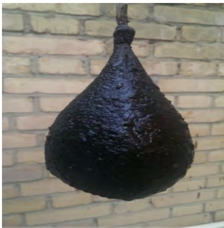
عکس ۷- راستی آزمایی روش تولید.

لایه‌گذاری بر روی قالب پارچه‌ای را آن‌قدر ادامه می‌دهند تا ضخامت اندود به یک سانتیمتر برسد. در میانه اندود و اضافه کردن لایه‌ها، قبل از آنکه ضخامت اندود به یک سانتیمتر برسد، هنگامی که ضخامت لایه‌ها به حدود پنج میلی‌متر رسید دو قطعه چوب را که از قبل به شکل دسته کوزه تراشیده‌اند، بر روی اندود می‌چسبانند و روی آنها را نیز، همانند سایر قسمت‌ها می‌پوشانند. (عکس ۸ و طرح ۱)