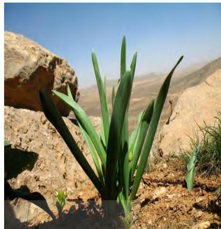
عکس ۱- گیاه لوه. چهارم‌حال و بختیاری. عکس ۲- ریشه لوه. چهارم‌حال و بختیاری.

ارزش نهادن و تقدس برخی از مواد خوراکی در نزد بختیاری‌ها یکی از جنبه‌های فرهنگی آنها به شمار می‌رود. موادی مانند: گندم، نمک، شیر (و فرآورده‌های آن) و عسل، که اصطلاحاً به آنها غذاهای فوق فرهنگی گفته می‌شود؛ در نزد مردمان این قوم از جایگاه ویژه‌ای برخوردار است. آن‌ها مانند سایر اقوام بدوی «غذاهای به اصطلاح فوق فرهنگی را همچون هدایای خدایان تلقی می‌کنند» (دوگارین، ۱۳۶۶: ۷-۴) و از این مواد به‌عنوان هدایای ویژه خداوند یاد می‌شود. در فرهنگ بختیاری، هرگونه رفتار و کنشی که به معنای خوار شمردن و بی‌احترامی به خوردنی‌ها باشد، مردود می‌شمارند. از این رو، تهیه ظروف، برای حفظ و نگهداری مواد غذایی و احترام به هدایای الهی است.