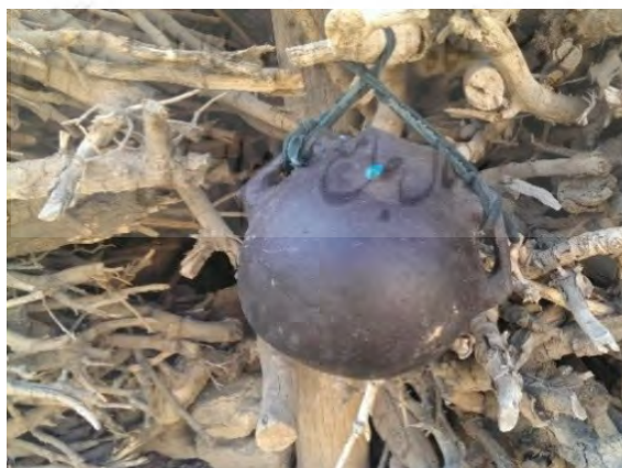
عکس ۱۲- بوکله در حال خشک شدن.