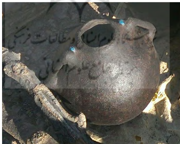
عکس ۸- دسته و فرم کلی لوه.

لایه‌گذاری بر روی قالب پارچه‌ای را آن‌قدر ادامه می‌دهند تا ضخامت اندود به یک سانتیمتر برسد. در میانه اندود و اضافه کردن لایه‌ها، قبل از آنکه ضخامت اندود به یک سانتیمتر برسد، هنگامی که ضخامت لایه‌ها به حدود پنج میلی‌متر رسید دو قطعه چوب را که از قبل به شکل دسته کوزه تراشیده‌اند، بر روی اندود می‌چسبانند و روی آنها را نیز، همانند سایر قسمت‌ها می‌پوشانند. (عکس ۸ و طرح ۱)