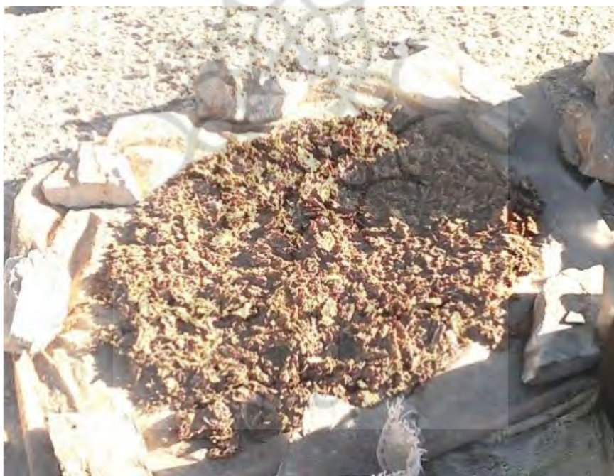
عکس ۳- آماده‌سازی لوه.

در شهرستان کوهرنگ از ساقه تازه رسته لوه در فصل بهار برای مصارف غذایی استفاده می‌گردد؛ اما در روستای صالح کوتاه از چیدن گیاه مذکور، تا اوایل تابستان خودداری و زمانی که گیاه پیر و در حال خشک شدن است، آن را از ریشه خارج نموده و ساقه آن را برای مصارف غذایی و ریشه آن را برای ساخت بوکله مهیا می‌کنند. به دلیل اینکه احشام تمایلی به چرای این گیاه ندارند، در فصل بهار، منطقه پوشیده از این گیاه می‌شود. پس از جمع‌آوری، شستشوی گیاه و زدودن گرد و خاک و گِل از ریشه، ریشه‌ها را به مدت دو هفته در مقابل نور آفتاب پهن نموده تا کاملاً خشک گردند. (عکس ۳)