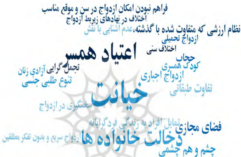
جدول (۴): فرایند فهرست موضوعات و مفاهیم مربوط به علل فرهنگی طلاق

در ذیل ابر واژگان علل اجتماعی طلاق آمده است. همان‌طور که مشاهده می‌شود عللی چون خیانت، اعتیاد همسر و دخالت خانواده‌ها مهم‌ترین دلایل اجتماعی طلاق از منظر صاحب‌نظران است.