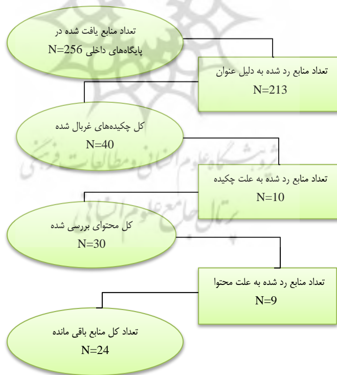
شکل شماره ۲: الگوریتم انتخاب مقاله‌های نهایی

در این مرحله از بین ۲۵۶ مقاله، ابتدا ۲۱۳ مقاله بر اساس معیار عنوان نامرتب حذف شد، سپس تعداد ۴۰ چکیده مورد بررسی قرار گرفت و تعداد ۱۰ مقاله به دلیل چکیده رد شد، در مرحله بعدی ۳۰ مقاله باقی ماند که بر اساس محتوا این ۳۰ مقاله مورد بررسی قرار گرفت و تعداد ۹ مقاله نیز به دلیل محتوا و کیفیت ضعیف رد شده و در نهایت ۲۴ مقاله باقی مانده و به عنوان مقاله نهایی پذیرفته شده و مورد بررسی قرار گرفت که الگوریتم غربالگری آن در شکل شماره دو آمده است.