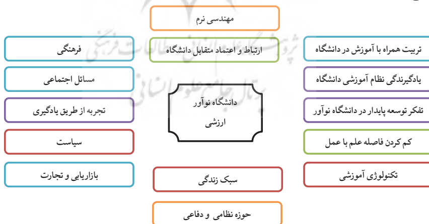
شکل ۲: مدل دانشگاه نوآور ارزشی

یکی از مهمترین پیامدهای حرکت از دانشگاه های نسل سوم (دانشگاه کارآفرین) به سمت دانشگاه های نسل چهارم (دانشگاه نوآور ارزشی)، اهمیت نقش تربیتی و همچنین جایگاه دانشگاه در پیشرفت و یا به عبارتی توسعه همه جانبه جامعه می باشد. دانشگاه نسل چهارم تاکید ویژه بر رسالت تربیتی اساتید و شأن و منزلت علم دارد و از طرفی بر اهمیت ارتباط بین علوم انسانی و شناختی با علوم فنی مهندسی و طبیعی دارد تا دانشگاه نوآور ارزشی در حل معضلات جامعه در عرصه های فنی، اجتماعی، فرهنگی، سیاسی و اقتصادی نقش ایفا نماید. نتایج یافته ها و تحلیل آنان و با در نظر گرفتن مبانی نظری، مدل دانشگاه نوآور ارزشی به شرح شکل ۲ می باشد.