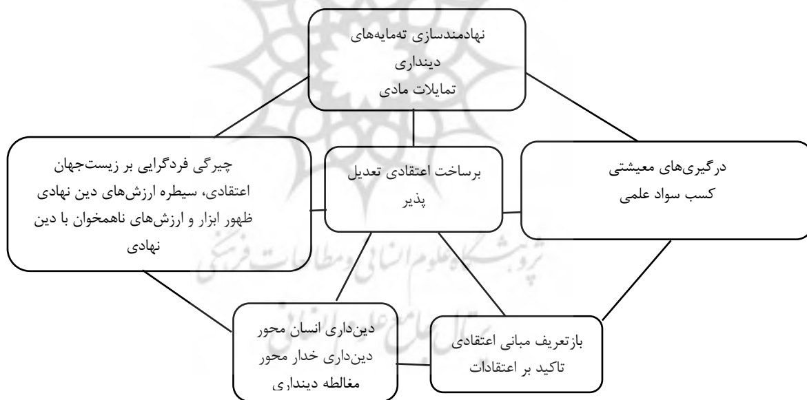
نمودار ۱: شبکه مضمونی برساخت دینداری تعدیل‌پذیر

نقشه مضمونی ترسیم شده نشان می‌دهد که مفهوم «برساخت اعتقادی تعدیل‌پذیر» دربردارنده کانون مفهومی دینداری دانشجویان است. این مفهوم بیانگر این است که دانشجویان در عین داشتن تجارب و معانی متفاوت از دینداری اکثراً در این مقوله اشتراک نظر دارند.