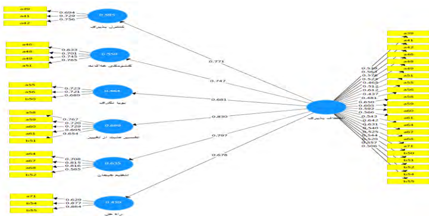
شکل 2. بررسی بارهای عاملی مربوط به انعطاف پذیری