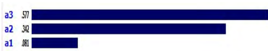
شکل 2: اولویت‌بندی و امتیازدهی معیارها با استفاده از نرم‌افزار Expert Choice

همان‌طور که در خروجی نرم‌افزار در شکل زیر نمایان است از دید کارشناسان معیار a3 که همان محرمانه ماندن اطلاعات اشخاص و سازمان است نسبت به دیگر معیارها از اولویت بیشتری برخوردار است (شکل 2).