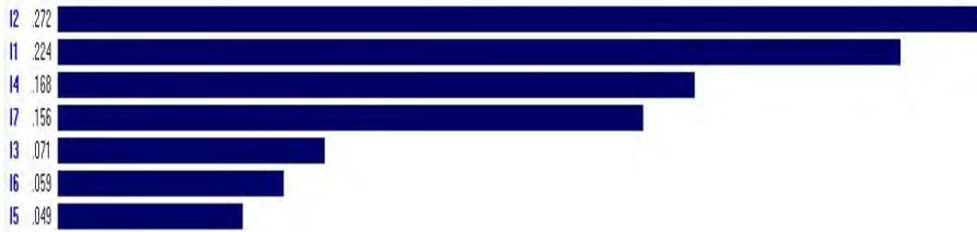
شکل 3: خروجی نرم‌افزار Expert Choice در اولویت‌بندی راهبردها براساس معیار a1

همان‌طور که در خروجی نرم‌افزار دیده می‌شود، از دید کارشناسان حوزه شبکه‌های اجتماعی مجازی اولویت راهبردها براساس معیار سرعت در انجام فعالیت‌های سازمان یا همان a1 به‌صورت زیر اولویت‌بندی و امتیازدهی شده است: