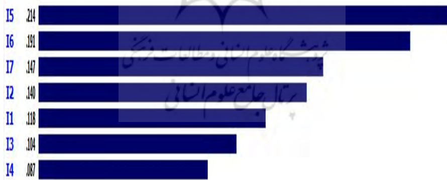
شکل 4: خروجی نرم‌افزار Expert Choice در اولویت‌بندی راهبردها براساس معیار a_2

در مرحله بعد، پس از وارد کردن داده‌ها در نرم‌افزار Expert Choice نمودار امتیازدهی و اولویت‌بندی راهبردها را بر اساس معیار a_2 را با استفاده از نرم‌افزار به دست آوردیم که خروجی نرم‌افزار در شکل زیر نمایان است (شکل 4).