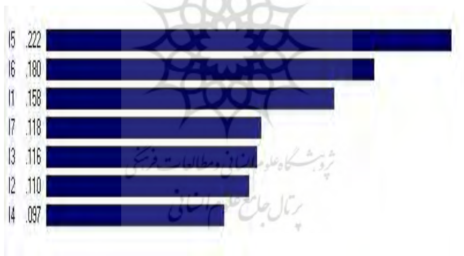
شکل 6: خروجی نهایی نرم‌افزار Expert Choice در اولویت‌بندی راهبردها

در نرم‌افزار Expert Choice پس از اتمام مراحل بالا یک خروجی کلی بر اساس هر سه معیار گرفتیم که به‌طور کامل در زیر آورده شده است.