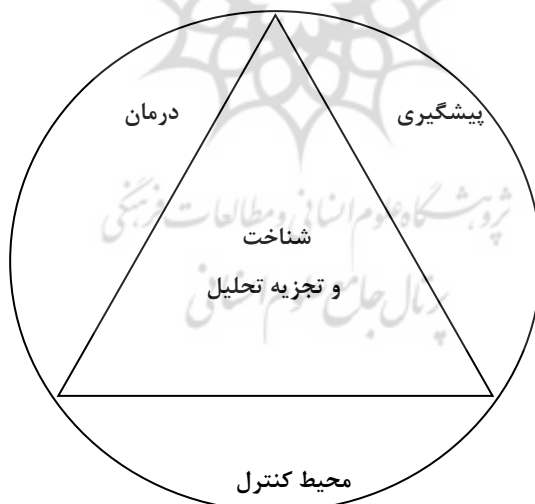
شکل (۲) شناخت و تجزیه تحلیل آسیب

در فرآیند مورد نظر، شناخت از جایگاه ویژه‌ای برخوردار است. بدون شناخت امکان شناسایی آسیب وجود ندارد. اگرچه کنترل نیز همانند سایر موارد اهمیت دارد، با این حال، کشف آسیب در مدار کنترل، بدون شناخت لازم و کافی از آسیب و حوزه‌های آن در مباحث ساختاری، رفتاری، کارکردی، فراساختاری و اطلاع از چگونگی و چرایی پیدایش آن امکان‌پذیر نمی‌باشد. به همین جهت تشخیص آسیب‌ها شاید نیمی از کار را تعیین و مشخص نماید. اما هنوز چگونگی برخورد با آن و اتخاذ روش درست به‌عنوان راه پیشگیری و درمان هنوز باقی است و این امر با تداوم روش‌های تجربی و اشرافیت بر علوم موجود همانند سه ضلع مثلث کارآمدی و اثربخشی سازمانی را تکمیل می‌کند (همان).