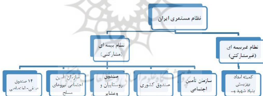
شکل ۲: نظام مستمری در ایران

رهیافت روش‌شناسی این پژوهش، کیفی است. روش گردآوری داده‌ها مطالعه اسناد و مقالات، قوانین و گزارش‌های سازمان تأمین اجتماعی، وزارت تعاون، کار و رفاه اجتماعی و سایر سازمان‌های مرتبط در خصوص نظام بازنشستگی بوده است.