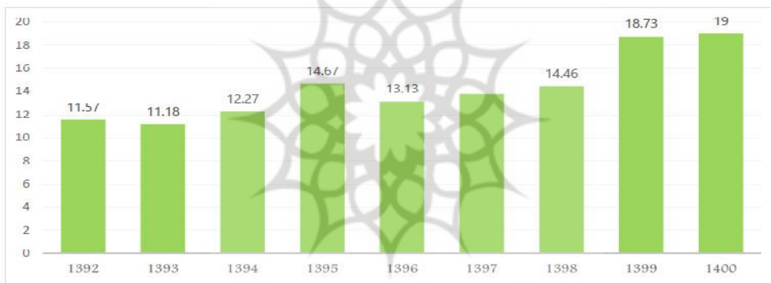
شکل ۳: درصد سهم دو صندوق کشوری و لشگری از هزینه‌های عمومی دولت