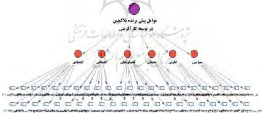
شکل شماره ۳: دسته بندی عوامل پیش برنده بلاک چین در توسعه کارآفرینی با استفاده از نرم افزار MAXQDA

بکارگیری نرم افزارهای رایانه‌ای در سال‌های اخیر با فراهم نمودن امکان دستیابی مطالعات با سرعت و دقت بیشتر و زمان کمتری به نتایج، نقش بسزایی در توسعه کاربرد تحلیل محتوا در تحقیقات کیفی داشته‌اند، بدین منظور محققین در این مطالعه با استفاده تحلیل نرم‌افزار MAXQDA، به طبقه‌بندی دسته‌ها و زیر دسته‌ها نتایج حاصل از داده‌ها پرداخته‌اند که در شکل (شماره ۳) قابل مشاهده است.