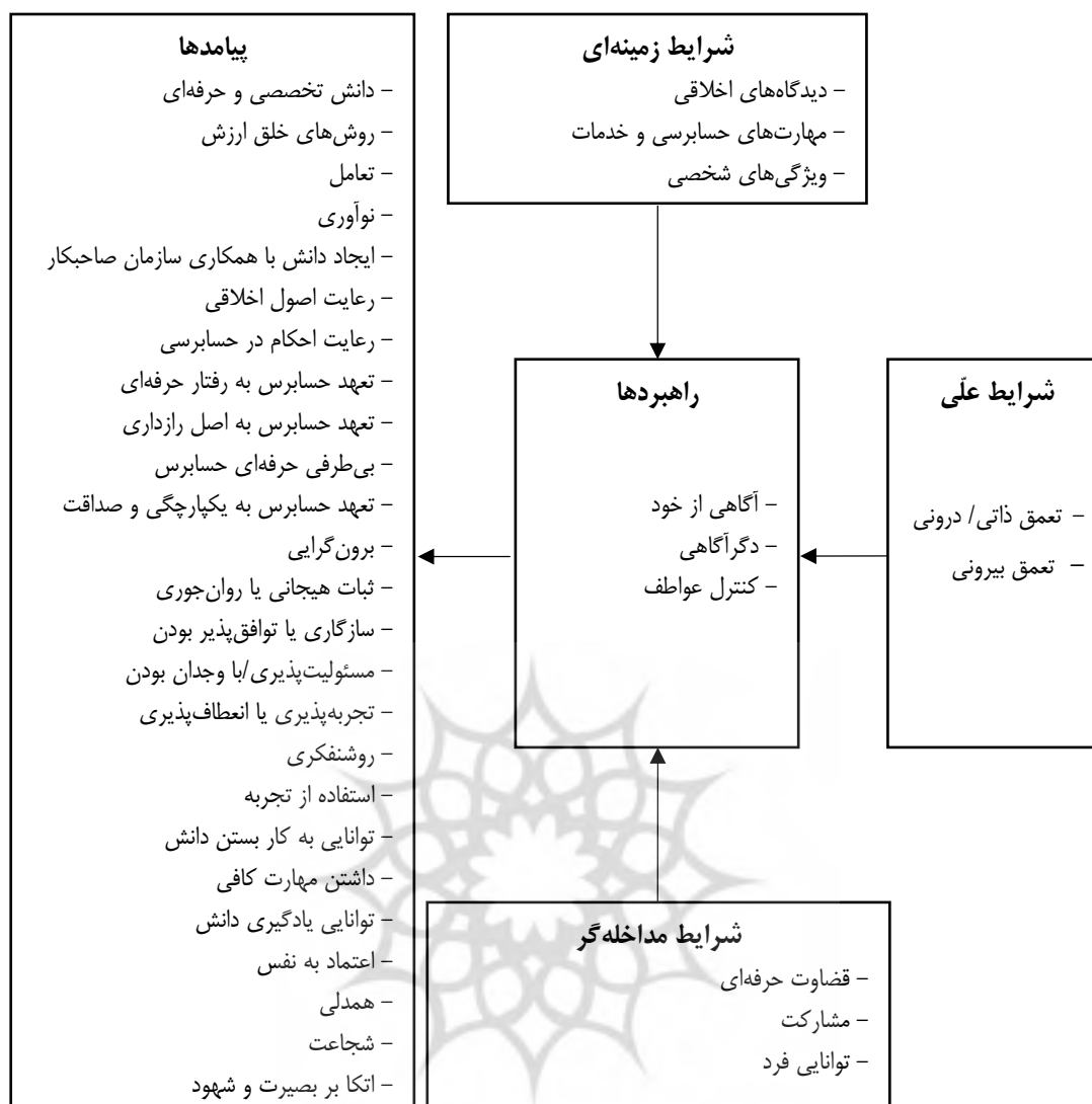
شکل ۲. مدل تصمیم‌گیری مبتنی بر خرد در حوزه حسابرسی