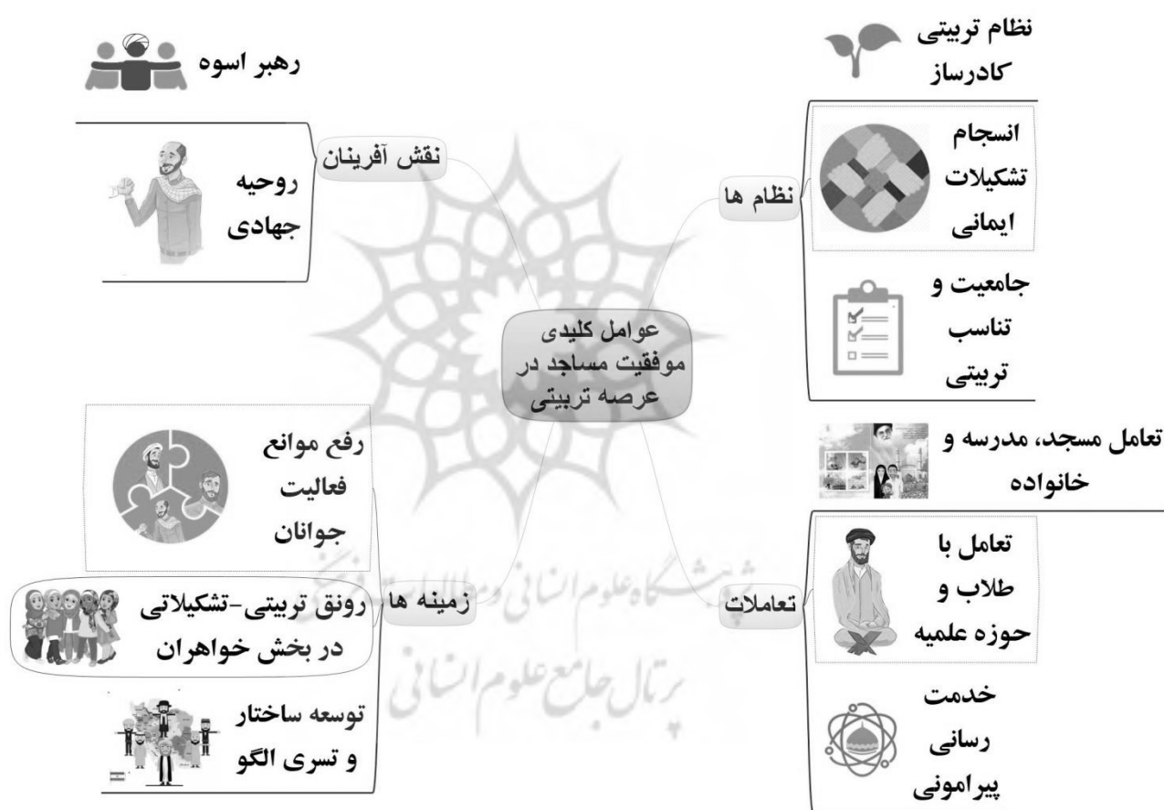
نمودار ۲: شبکه مضامین عوامل کلیدی موفقیت مساجد در عرصه تربیتی