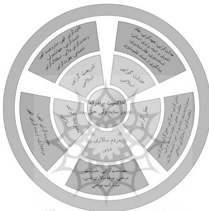
نمودار ۴. ابعاد و مؤلفه‌های حاکمیت مطلوب در قرآن کریم

مؤلفه‌ها، ۵ بعد شریعت‌گرایی اسلامی، عدالت‌گرایی اسلامی، عقل‌گرایی، مردم‌سالاری دینی و معنویت‌گرایی اسلامی احصا شد. مدل نهایی پژوهش را می‌توان در قالب نمودار ذیل ترسیم کرد: