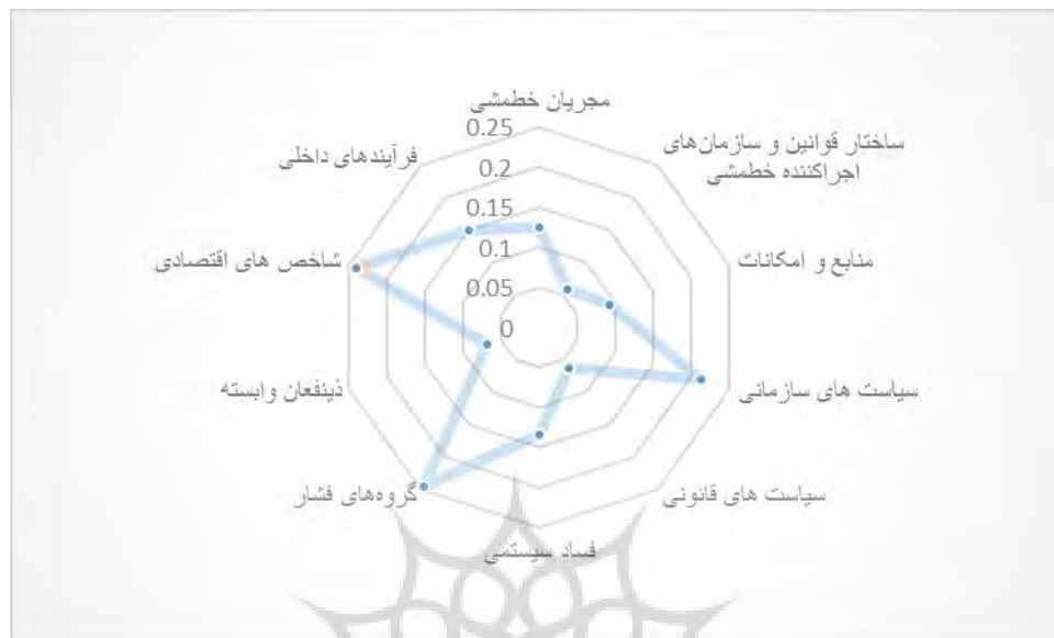
شکل شماره ۱: رتبه بندی شاخص‌های پژوهش