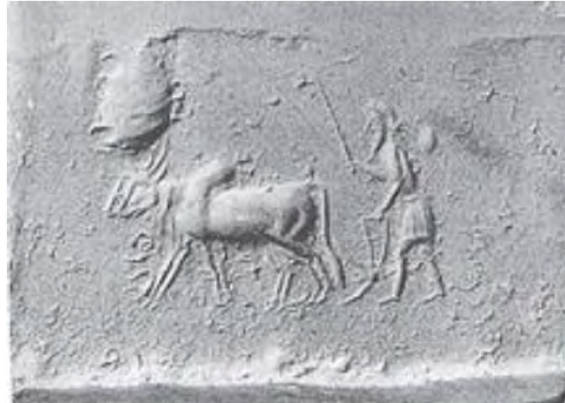
شکل ۱. گاو کوهان‌دار بر روی مهر هخامنشی موزه لوور