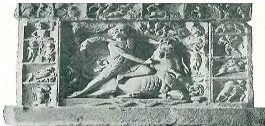
شکل ۶. نقش برجسته میترا در حال کشتن گاو در غاری در نزدیکی

سمت چپ گاو در حالت لمبیده (موزه بوعلی سینا عکاس سیدی تبار)