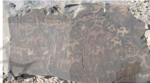
شکل ۲. سمت راست نقش گاو کوهان‌دار در سنگ‌نگاره نهبندان ( http://new.shabestan.ir/detail/News/869979s ) سمت چپ: گاو کوهان‌دار منطقه کوچری (Jamali, 2014)