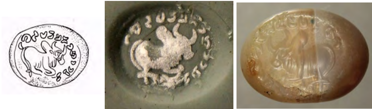
شکل ۱۰. اثر مهر و طرح مهر گاو کوهان‌دار در حالت لمبیده (موزه بوعلی همدان)

بعد از آن سه حرف با فاصله از هم نوشته شده است. عبارت دینی زرتشتی abestān ō yazdān : توکل بر یزدان، در بسیاری از مهرها و اثر مهرهای دوره ساسانی مشاهده شده است. این عبارت که بسیار بر روی مهرها دیده می‌شود، شاید دارای معنی سحرآمیز برای جلب لطف یا حمایت نیروهای خدایی برای مالک آن باشد (Ghirshman, 2010). حضور این عبارت به‌تنهایی دلیل بر مالکیت آن مهر توسط دین‌مردان نیست.