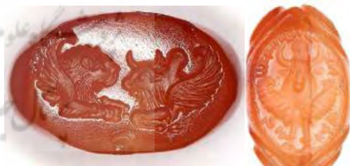
شکل ۹. سمت راست گاو کوهان‌دار بال‌دار از روبه‌رو، سمت چپ

تصویر گاو بالدار و شیر بالدار در حالت لمیده، روبه‌روی هم و بدون هیچ‌گونه علامتی از جدال، از دیگر نقوش مرتبط با گاو بر مهرهای ساسانی است که دو نمونه از آن در مجموعه سیگیلای اتریش نگهداری می‌شود (شکل ۹). نقش گاو در هیبت گوساله‌ای که در حال مکیدن شیر است نیز از نقوش درخور توجه مهرهای ساسانی به شمار می‌آید (Göbl, 2005). به‌طور کلی تعداد گاوهای نر کوهان‌دار در حالت ایستاده به‌مراتب بیشتر از گاوهای کوهان‌دار در حالت لمیده است.