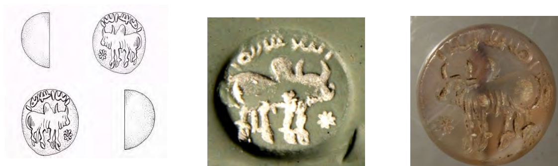
شکل ۱۲. اثر مهر و طرح مهر گاو کوهان دار ایستاده (موزه بوعلی همدان)