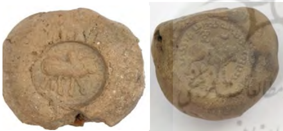
شکل ۳. دو گل مهر با نقش مایه گاو کوهان‌دار از مجموعه‌های تخت سلیمان و قصر ابونصر در موزه ملی ایران

گاو کوهان‌دار در مهرهای ساسانی به صورت‌های گوناگون نقش بسته است. گاهی تصویر گاو از نیم‌رخ و گاهی از روبه‌رو، به صورت انفرادی یا دوتایی در حالت‌های ایستاده یا لمبیده در شرایط محیطی عادی یا در صحنه شکار به تصویر کشیده شده است (شکل ۴). از نظر گوبل گاو کوهان‌دار در ارتباط با آیین آناهیتا-ناناست (Göbl, 2005).