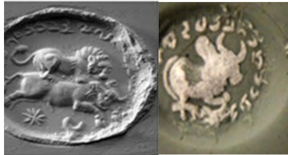
شکل ۴. سمت راست جدال شیر با گاو

از نظر لاجرد صحنه قربانی گاو صحنه رستگاری و نجات است که با بهره‌گرفتن از خون ازلی و همسان‌شدن با خدا در ابدیت اتفاق می‌افتد. شاید تقدس قربانی گاو را بتوان به اهمیت گاو در اذهان اقوام هند و اروپایی، آشوری و آسیای صغیر مرتبط دانست که تجلی قدسی خدای زایاننده بوده و به‌عنوان مظهر آثار جوی (خدای جوی زمین) پرستیده می‌شده است ( Jalali Naini, 1996; Lajard, 2011).