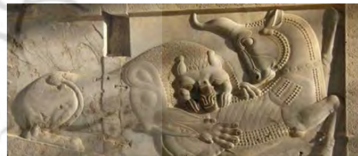
شکل ۵. برد شیر و گاو در تخت جمشید

صحنه نبرد شیر و گاو از نقش‌مایه‌های مهمی است که بر روی مهرهای ساسانی حک شده است. این صحنه که در تخت جمشید (شکل ۵) نیز به تصویر کشیده شده است، حاکی از نبردی هوشمندانه میان گاو، نماد شب، در تجسم ایزد پام نیات و شیر، نماد روز، در تجسم ایزدمهر است ( Garrison & Cool, 2001; Root, 2001). برخی کشته‌شدن گاو توسط ایزدمهر (شکل ۶) را به شروع آفرینش تعبیر کردند ( Garris, 2008; Soudavar, 2014).