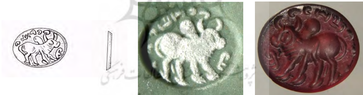
شکل ۱۱. اثر مهر و طرح مهر گاو کوهان‌دار در حالت ایستاده (موزه بوعلی همدان)

دومین مهر این گروه به شماره ثبتی ۴۶۳۴ (شکل ۱۱) مهری از جنس یاقوت سرخ به طول و عرض ۷ میلی‌متر با وزن ۰/۴ گرم است. نقش مایه گاوی کوهان‌دار رو به سمت چپ در حالت ایستاده است. کتیبه اطراف آن از ساعت ۴: حرف‌نویسی: [pst'n[1 yzd'n] آوانویسی: abestān[ō yazdān] ترجمه: توکل بر یزدان. کتیبه از ساعت ۴ با دو حرف آغاز می‌شود و ادامه آن از ساعت ۱۲ است. واژه 'pst'n به‌وضوح خوانده می‌شود، ولی