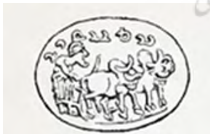
شکل ۷. سمت راست (Horn & Steindorff, 1891)

سمت چپ ( https://www.numisbids.com/n.php )