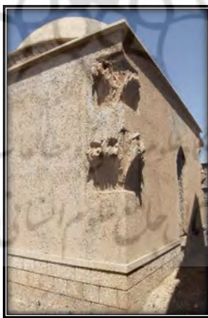
شکل ۶. اتصال مردگرد، گوشه جنوب غربی