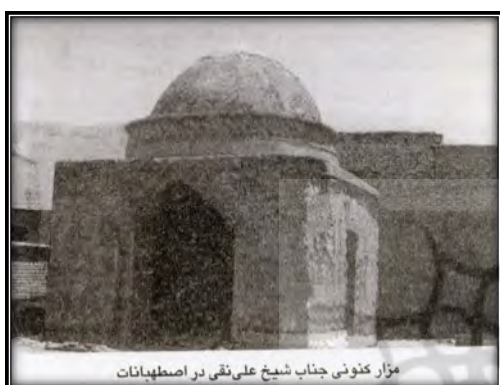
مزار کنونی جناب شیخ علی‌نقی در اصطهبانات

گزینشی عمل کرده و به نوشته خاوری پیش از آن خاطره، اشاره‌ای نکرده است: «این قطب ذهبی که از سال‌های ۱۱۲۰ تا پایان عمرش را در اصطهبانات به سر برده است [...] در سنین بین ۷۷ تا ۸۵ سالگی خرجه تهی نموده است. مدفن وی در اصطهبانات می‌باشد [...]» (Khavari, 2004); ششم، کتاب اصول تصوف نیز محتوایی خلاف آنچه نقل شده را نشان