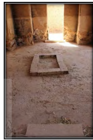
شکل ۲. مکان سنگ قبر؛ فرسایش پای دیوار