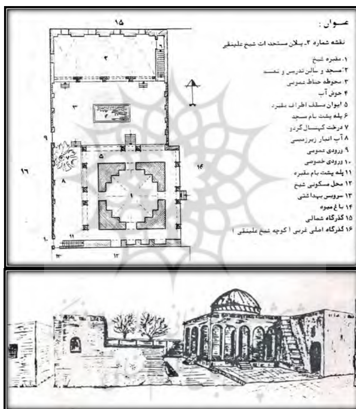
شکل ۸. پلان و طرح مجموعه (Iran Pooyesh Consulting Engineers, 1983)

همچنین اقدامی برای مرمت و بازسازی آن صورت نگرفته و حریم آن با احداث بناهای مرتفع، نقض شده است و در سال