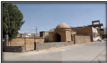
شکل ۱۲. نقض حریم هوایی (Author, 2021)