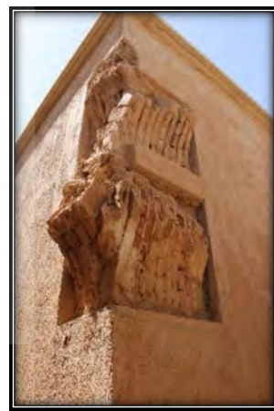
شکل ۵. اتصال مردگرد، گوشه جنوب شرقی (Author, 2021)

تخریب است (شکل ۹) که در تصویر هوایی سال ۱۳۶۸ به کلی محو شده‌اند (شکل ۱۰). با وجود آنکه «گزارش‌های مطالعات طرح توسعه و عمران، حوزه نفوذ، جامع و تفصیلی شهر استهبان» در سال ۱۳۶۲ با اشاره به ارزش‌های مذهبی و