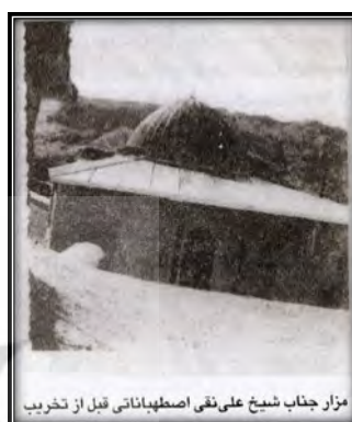
مزار جناب شیخ علی‌نقی اصطهباناتی قبل از تخریب