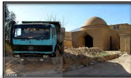
شکل ۱۱. دیوار تخریب شده (Kashfi, 2011)

آن جناب در شهر اصطهبانات- استهبان امروزی- مطاف اهل دل است» (Estahbanati, 2003). ۳- سپس عنوان می‌کند: «آن دسته از منابعی که به شرح احوال اقطاب ذهبیه پرداخته‌اند، محل دفن شیخ را زادگاهش اصطهبانات ذکر کرده‌اند» و در ادامه به موضوع مکاشفه میرزا احمد شیخ‌الاسلام ۲۲ و آقا میرزا حسین ۲۳ درباره ساخت بنا پس از نیمه اول قرن چهاردهم هجری اشاره کرده و آن را به کتاب‌های «اصول تصوف» و «ذهبیه» ارجاع می‌دهد. در این رابطه اول، به نظر می‌رسد اجماع نظر این دست از منابع، نشان از اعتبار بالای این روایت است؛ چراکه توسط اقطاب و پیروان این سلسله بیان شده است. دوم، خاطره روایت‌شده تنها در کتاب ذهبیه نقل شده که منبع آن مشخص نیست و در منبعی دیگر نیز با عنوان «تعمیر» آورده شده است (Iran Pooyesh Consulting Engineers, 1983). سوم، بررسی و تشخیص عمر بناهای تاریخی امری تخصصی است که نیازمند بررسی‌های دقیق کارشناسی است. چهارم، در نسخه چاپی کتاب برهان المراتضین، دو بنا با سبک و معماری کاملاً متفاوت که یکی مربوط به پیش از تخریب و دیگری بنای کنونی است، نشان داده شده است (شکل ۱۳). پنجم کرباسی‌زاده اصفهانی