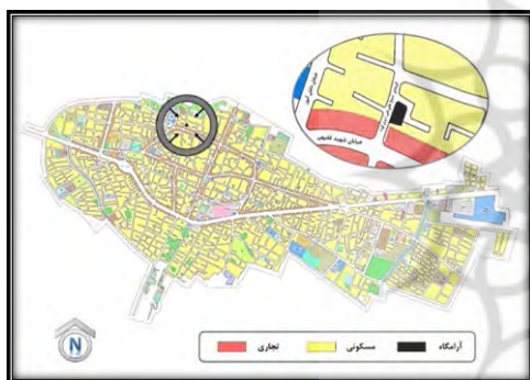
شکل ۱. موقعیت بنا (Author, 2021)

دیرگاهی نبود به وسیله نجیب‌الدین‌رضا از خراسان به اصفهان نقل مکان کرده بود، به فارس منتقل کرد و با تربیت سید قطب‌الدین محمد نیریزی ۲۰ به‌عنوان یکی از مؤثرترین و مهم‌ترین اقطاب سلسله ذهبیه، ادامه این سلسله را در فارس تثبیت و تداوم بخشید. با درگذشت شیخ در سال ۱۱۲۹ ق، سید قطب‌الدین خرقة هدایت به تن کرد و ضمن تولیت آستان شاه‌چراغ، به ترویج دیدگاه‌های ذهبیه و گسترش پیروان آن پرداخت. رساله برهان‌المرتاضین و دعای جوشن کبیر به خط نسخ معرب، تنها تألیف و آثار به‌جامانده از شیخ علی‌نقی در دوران کوتاه ۱۸ سال هدایت و ارشاد سلسله ذهبیه است. وی در استهبان و در مکان آرامگاه کنونی به خاک سپرده شده است (شکل ۱) (Estakhri, 1934; Khavari, 2004).