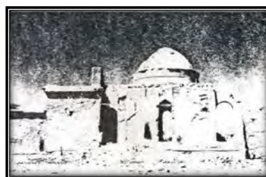
شکل ۹. راست: آرامگاه. چپ: آرامگاه و مسجد (Iran Pooyesh Consulting Engineers, 1983)