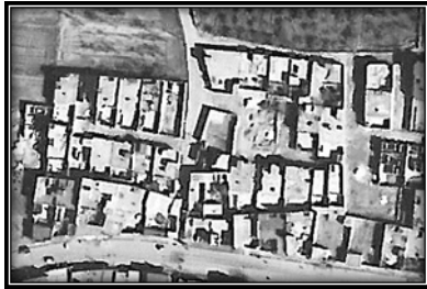
شکل ۱۰. تصویر هوایی. راست: سال ۱۹۵۶. چپ: سال ۱۹۸۹ (National Cartography Center of Iran)