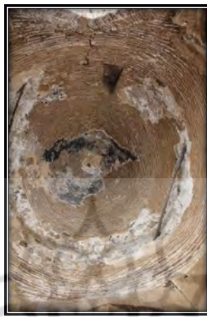
شکل ۳. فرسایش زیر گنبد (Author, 2021)