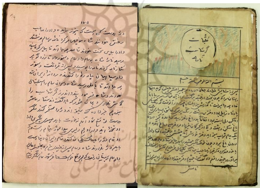
تصویر ۱- راست: صفحه آغازین متن اصلی (پس از صفحه عنوان)؛ چپ: صفحه پایانی متن

«شاه و سام پس از چندی بزم و نخچیر اجازه داد سام به سیستان رفت که هر موقع خواست حاضر شود. تمام شد گرشاسب نامه». چند برگ آخر را هم از تاریخ سیستان نقل می کند که می توان آن را ضمیمه کلیات گرشاسب نامه دانست.