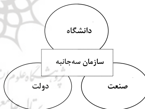
شکل (۱) مدل سه جانبه دانشگاه کارآفرین (ارتباط بین صنعت، دولت و دانشگاه)، منبع (انزکوینتز و لیدسدروف، ۲۰۰۰)

می‌گردد (گوررو ۱ و همکاران، ۲۰۱۵). سه حوزه دولتی، خصوصی و دانشگاهی در گذشته در محیط اقتصادی آزاد عمل می‌کردند، اما در حال حاضر در الگوی سه جانبه درگیر شدند که در مراحل مختلف فرایند نوآوری ظاهر می‌شوند. هدف عمده این الگو توسعه محیط خلاق و نوآور است که از طریق تقویت کارآفرینی می‌توان به آن دست یافت. در این الگو به چند عامل باید توجه کرد: تأسیس شرکتهای منشعب از دانشگاه، ابتکارات سه جانبه بمنظور توسعه اقتصادی دانش‌محور از جمله پارک علم و فناوری، ایجاد هماهنگی استراتژیکی بین شرکتهای، تأسیس نهادهای ترکیبی بعنوان واسط و به شکل غیرانتفاعی و عقد قرارداد تحقیق و توسعه با آزمایشگاه‌های دولتی و گروه‌های تحقیقاتی دانشگاهی (مارکویز و همکاران، ۲۰۰۶). با توجه به این مدل انتظار می‌رود که دانشگاه یک جریان نوآوری ایجاد و قابلیت کارآفرینی موردنیاز جامعه را فراهم نماید. لذا برای رسیدن به این منظور می‌بایست رابطه دانشگاه - جامعه - صنعت بصورت تعاملی باشد، زیرا دانشگاه کارآفرین نقش مؤثری در کاربردی نمودن نهادهای برای تولید علم را دارد (نوبخت‌وند و همکاران، ۱۳۹۲).