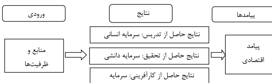
شکل ۲. مدل پیشنهادی دانشگاه کارآفرین. منبع (گورو و همکاران، ۲۰۱۵)

مرحله دوم فرایندها که شامل آموزش، پژوهش، مدیریت، پشتیبانی، تجاری‌سازی انتخاب و گزینش دانشجویان، اساتید و کارکنان، تامین مالی، شبکه‌سازی، فرایندهای تعامل چندجانبه بین دانشجویان، اساتید، کارکنان، محققین صنعت، مراکز کارآفرینانه، صنایع، سیاستگذاران و جامعه و در نهایت فعالیت‌های نوآوری، تحقیق و توسعه می‌باشد. مرحله سوم خروجی‌هاست که شامل منابع انسانی کارآفرین (اساتید، دانش‌آموختگان، محققین و کارکنان)، تحقیقات اثربخش در راستای نیازهای بازار، نوآوری‌ها و اختراعات، شبکه‌های کارآفرینانه و مراکز کارآفرینانه (برای مثال انکیباتورها، پارک‌های علم و فناوری، شرکت‌های انشعابی و...) می‌باشد. پیامد این خروجی‌ها، پدیدار شدن دانشگاه نسل سوم یا همان دانشگاه کارآفرین است.