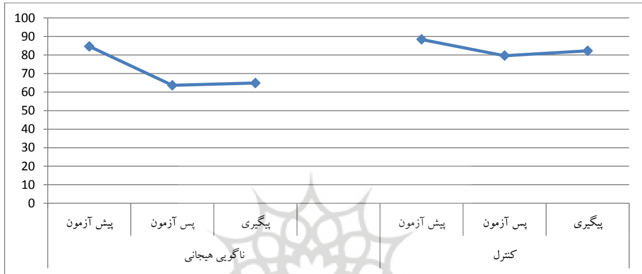
نمودار ۳. میانگین آزمودنی‌ها در حالت‌های پیش آزمون، پس آزمون و پیگیری و به تفکیک دو گروه

واریانس با اندازه‌گیری مکرر ۲*۳ استفاده شد. نتایج این تحلیل نشان می‌دهد که تحلیل واریانس آمیخته تغییرات معنادار دو گروه را برای عامل درون گروهی (اثر اصلی میزان تغییرات سطح سیستم‌های مغزی - رفتاری زنان دارای ناگویی هیجانی بالا و زنان دارای اضطراب اجتماعی) ( \eta^2 = 0/989 و P = 0/001 ، F_{(1, 14)} = 562/93 ، P = 0/011 = ویلکز لامبدا) نشان داد و اثرات گروه و تعاملی میزان تغییرات در ناگویی هیجانی زنان دارای ناگویی هیجانی و اضطراب اجتماعی زنان دارای اضطراب اجتماعی بر اساس سیستم‌های مغزی - رفتاری آن‌ها، زمان و گروه نیز معنادار بود ( \eta^2 = 0/823 و P = 0/048 ، F_{(1, 14)} = 30/121 ، P = 0/177 = ویلکز لامبدا).