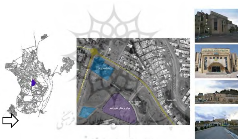
تصویر ۲- محدوده نمونه مورد مطالعه در شهر سنندج

مجتمع فرهنگی هنری فجر در جنوب شرقی شهر سنندج و ابتدای بلوار گریاشان واقع است؛ کلنگ ساخت مجتمع فرهنگی هنری فجر در سال ۱۳۷۱ زده و بعد از ۱۰ سال یعنی در سال ۱۳۸۱ افتتاح شد. این مجموعه محل برگزاری بسیاری از کنسرت‌ها و تئاترها و... می‌باشد و همچنین دفتر انجمن‌های هنری مختلف در این مکان هستند. در سال جاری نیز هنرستان هنرهای زیبا در بخشی از این مجموعه شروع به فعالیت کرده است. مجتمع فجر دارای ۳ طبقه که شامل طبقه زیرزمین طبقه همکف و طبقه اول می‌باشد که هر طبقه نیز دارای سه بخش است.