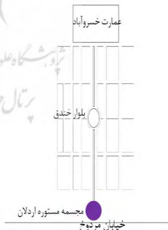
تصویر ۱- مجسمه مستوره اردلان و محدوده قرارگیری در شهر سنندج