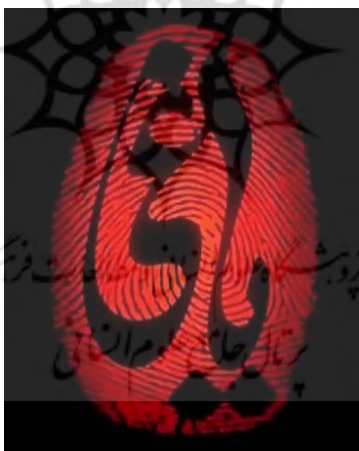
تصویر ۵. تایپوگرافی سریال باغی.

امروزه خوانندگان با متون چندوجهی که شامل تصاویر بصری و انواع عناصر طراحی گرافیکی است با فراوانی بیشتر نسبت به متونی که عمدتاً بر زبان نوشتاری تمرکز دارند مواجه می‌شوند (Serafini, Clausen, Lou Fulton, ۲۰۱۲: ۲). تایپوگرافی،