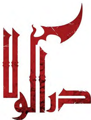
تصویر ۲. تایپوگرافی سریال دراکولا.

تایپوگرافی عنوان فیلم، یک عنصر طراحی قدرتمند است که می‌تواند به داستان فیلم اشاره کند و علاوه بر آن به ژانر و فضای کلی فیلم نیز اشاره دارد (Turgut, ۲۰۱۲: ۵۸۴). حروف‌نگاری سریال دراکولا به عنوان یک نشانه، توانایی ایجاد رابطه‌ای حس-ادراکی با مخاطب دارد. نشانه ارجاعی می‌تواند زمینه اتصال نشانه به مرجع خود را فراهم کند. یعنی تصویر یا نشانه ردی از واقعیت به حساب می‌آید (شعیری، ۱۳۹۲: ۳۲). تایپوگرافی فیلم دراکولا احساسی از خشونت را القا می‌کند که در ارتباط با محتوای فیلم است. دراکولا موجودی است که جزو دسته هیولاها قرار می‌گیرد. دراکولا در اصل نام فرمانروایی در کشور رومانی بوده که حاکمی ستمگر بوده است. او برای اینکه مردمان و خدمه‌اش به دستوراتش اطاعت کنند، قصر خود را با تمثال‌هایی خشن و ترسناک مزین کرده و قصرش را به رنگ قرمز درآورده بود. باید در نظر داشت معمولاً دراکولاها دارای قصری تاریک و فرسوده و دور از دسترس عموم مردم و همچنین با ستون‌های بسیار بلند بودند که شمایی از این المان را به عنوان دال، به صورت حروف کشیده و بلند، بسیار ساده و صریح می‌توان در تایپوگرافی سریال دراکولا در تصویر ۲ مشاهده کرد. به عبارتی دیگر، نماد و تصویر ستون‌های کشیده قصر دراکولا، جانشین حروف کشیده این کلمه شده‌اند. شکل و قرارگیری حروف، نمایانگر قصر دراکولا است که در این سریال نیز نمودی از قصر را به عنوان خانه‌ی شخصیت اصلی سریال می‌توان مشاهده کرد. درواقع، شیوه طراحی شکل تصویری نشانه، ارجاع به قصر دارد. شخصیت دراکولاها دارای دندان‌های بلند و تیزی هستند. نمادی از این المان را نیز به عنوان