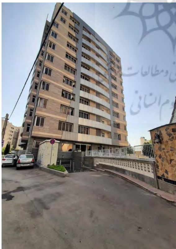
تصویر ۲. ضلع جنوب غربی که سمت معبر و ورودی به محوطه حیاط ساختمان است

در تصاویری که ارائه گردیده است نماهای ساختمان مسکونی پردیس چمران قابل مشاهده است. تصویر شماره یک که نمای اصلی ساختمان است و در ضلع جنوب غربی قرار گرفته است (نمای ضلع شمال شرقی ساختمان نیز عیناً به همین شکل طراحی و اجرا گردیده است و مقارن با نمای جنوب غربی است). تیپ بندی پنجره‌ها را مشخص می‌کند و ترکیب سایر مصالح نما در آن قابل مشاهده است؛ که با برآورد انجام شده مشخص گردید که در حدود ۳۰ درصد از کل سطح نما، جنوب غربی و شمال شرقی را، پنجره‌های دوجداره تشکیل داده‌اند؛ و مابقی آن از ترکیب دو مصالح ورق‌های کامپوزیت آلومینیوم و سنگ استفاده شده است. همچنین در تصویر شماره ۲ چنانکه مشاهده می‌گردد کمتر از ۱۰ درصد سطح نمای شمال غربی از پنجره‌های دوجداره تشکیل شده است (نمای ضلع جنوب شرقی ساختمان نیز عیناً به همین شکل طراحی و اجرا گردیده است و مقارن با نمای شمال غربی است). و بقیه سطح نما از ترکیب دو مصالح ورق‌های کامپوزیت آلومینیوم و سنگ استفاده شده است.