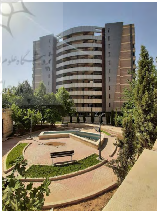
تصویر ۱. ضلع شمال غربی ساختمان