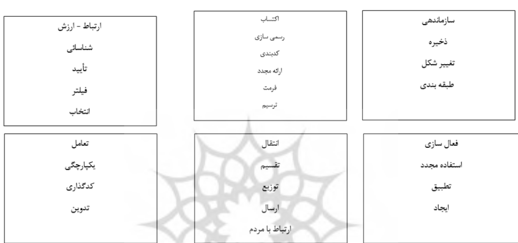
شکل ۱. چارچوب کلی مدیریت دانش (منبع: لیتراس ۴ و همکاران، ۲۰۱۲)

دانش مخلوطی سیال از تجربیات، ارزش‌ها، اطلاعات موجود و نگرش‌های نظام‌یافته است که چارچوبی برای ارزشیابی تجارب و اطلاعات جدید و بهره‌گیری از آن‌ها را به دست می‌دهد (داونپورت و پروساک ۱ ، ۱۳۹۰). از منظری دیگر دانش اطلاعات آمیخته با تجربه، مضمون، تفسیر و اندیشه است که می‌تواند به‌عنوان منبعی تجدید شدنی به کرات مورد استفاده قرار گیرند و از طریق کاربرد و ترکیب با تجربه کارکنان در حافظه سازمان انباشته شده و به یادگیری در سازمان بینجامد (گوتسچالک ۲ ، ۲۰۱۷). در این بین مدیریت دانش به‌عنوان یک رهیافت یکپارچه برای سازماندهی کل سرمایه‌های فکری و معنوی سازمان تعریف می‌شود که نه تنها دانش عیان مورد استفاده در سازمان بلکه دانشی که در اذهان کارکنان نهفته است نیز در این راستا ساختار می‌بخشد (فرگوسن و کرت ۳ ، ۲۰۱۰). بر این اساس می‌توان چارچوب اساسی مدیریت دانش را با توجه به تصویر شماره یک نشان داده می‌شود.