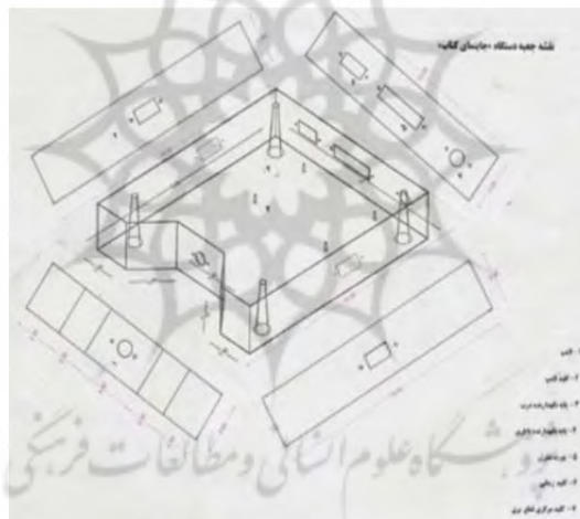
تصویر ۱. نقشه و طراحی سه بعدی از دستگاه جاینا

ابزارهای ابداعی در ابتدا نیاز به طراحی صنعتی دارند. چنانچه در فرهنگ معین طراحی یعنی «طرح افکنی، نقشه‌ریزی، طرح نقاشی و شیوه‌ای از نقاشی که جنبه طرح آزمایشی و تمرینی دارد» معنی شده است (معین، ۱۳۴۷). تفکر طراحی در این تحقیق بیشتر بعد طراحی صنعتی می‌باشد. در ابتدا هر دستگاه و ابزاری که جدید باشد، قبل از هر چیز (و بالقوه) تصویری از آن در ذهن ایجاد می‌شود.