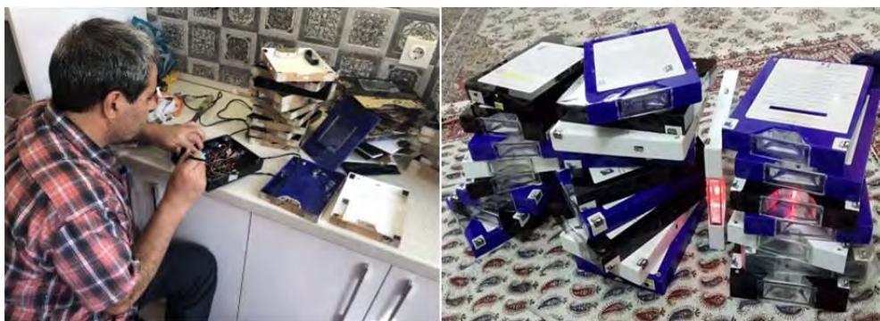
تصویر ۳. عکس پژوهشگر در حال ساخت ۵۰ عدد از «دستگاه جاینمای کتاب»

انجام پژوهش «دستگاه جاینمای کتاب» چیزی جز این هدف نیست. چون در ابتدا مسئله‌ای بود ذهنی و فکری، که ساخت آن غیر ممکن می‌نمود. اما با پذیرش به عنوان طرح پژوهشی و در قالب رساله دکترا، ایده نو وارد فاز گسترده‌تر و عملیاتی و منجر به دستاورد جدید ساخت «دستگاه جاینمای کتاب» شد. آنچه پژوهش حاضر را با دیگر پژوهش‌ها متمایز می‌سازد این است که این پژوهش کاملاً عملیاتی و فنی و ساخت ابزار ابداعی می‌باشد.