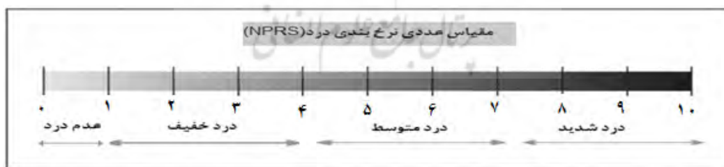
شکل ۱. مقیاس عددی نرخ‌بندی درد

اندازه‌گیری لاکتات خون: سطوح لاکتات خون آزمودنی‌ها در زمان‌های قبل از شروع پروتکل (بعد از حداقل ۱۰ ساعت گرسنگی شبانه) و همچنین بلافاصله بعد از پایان آزمون و ۳۰ و ۶۰ دقیقه بعد از آن؛ با استفاده از دستگاه لاکتومتر ۳ مدل HP-Cosmos ساخت آلمان در محل انگشت