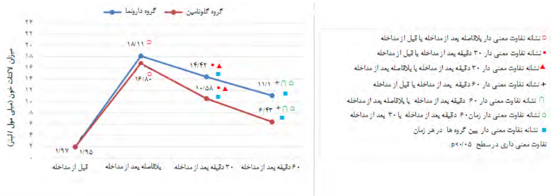
شکل ۲. مقایسه میزان لاکتات خون در دو گروه مصرف کننده مکمل گلوتامین و دارونما در زمان های مختلف اندازه گیری