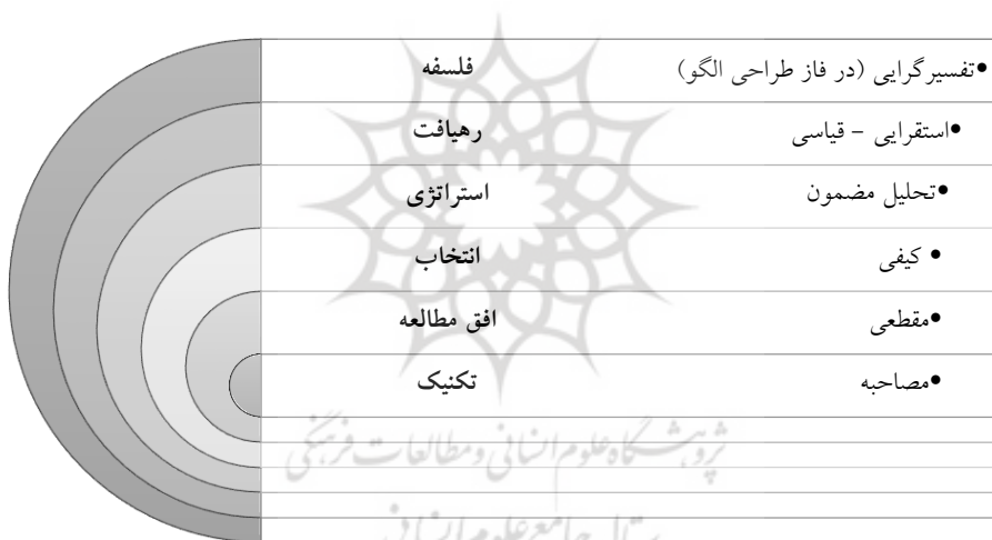
شکل (۱) پیازه فرایند پژوهش

هدف این پژوهش شناسایی و کاربست مهارت های کارآفرینانه در توسعه صنعت ساختمان مبتنی بر اقتصاد اشتراکی است که به صورت اکتشافی و با هدف کاربردی ارائه می شود. بر این اساس با ابزار مصاحبه و روش پژوهش کیفی با استفاده از استراتژی تحلیل مضمون داده های پژوهش گردآوری و تحلیل شده است. گردآوری داده ها تا رسیدن به حد اشباع نظری ادامه یافته است و این مهم در مصاحبه یازدهم حاصل گردیده است. جهت اطمینان از روایی پژوهش از روش های بررسی توسط اعضاء و بازبینی توسط همکاران استفاده شده است. برای بررسی پایایی تحقیق از روش بازآزمون و توافق بین دو کد گذار استفاده گردیده است. در ادامه و در شکل (۱) پیازه فرایند تحقیق ارائه شده است.