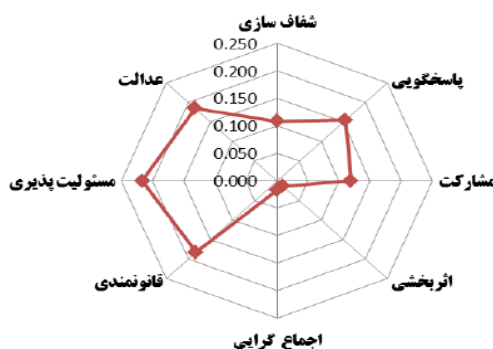
شکل ۳. مقایسه وزن شاخص‌های حکمروایی خوب شهری

از آنجایی که شاخص‌های حکمروایی شهری از اهمیت یکسانی برخوردار نمی‌باشند، لذا برای ارزیابی دقیق‌تر لازم است تا اهمیت و یا وزن نسبی هر کدام از آنها مشخص گردد. در این راستا از روش‌های متفاوتی استفاده می‌گردد. در تحقیق حاضر از تحلیل سلسله مراتبی (AHP) برای تعیین وزن شاخص‌ها استفاده شده است. به منظور وزن دهی به شاخص‌های پیشنهادی از نظرات کارشناسان مرتبط با حوزه تخصصی بهره‌گیری گردید. وزن به دست آمده از شاخص‌ها در جدول ۵ نشان می‌دهد که شاخص مسئولیت پذیری (با وزن شاخص ۰/۲۱۶) و عدالت (با وزن شاخص ۰/۱۸۶) به ترتیب بیشترین وزن را به خود اختصاص داده‌اند و کمترین امتیاز برای شاخص اثر بخشی با میزان ۰/۰۱۴ می‌باشد. جدول (۳).