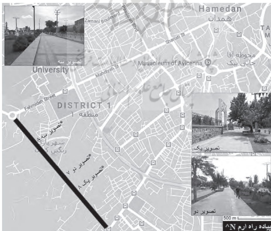
تصویر (۳). موقعیت و تصاویر پیاده‌راه ارم در شهر همدان. ترسیم نگارنده، ۱۴۰۰