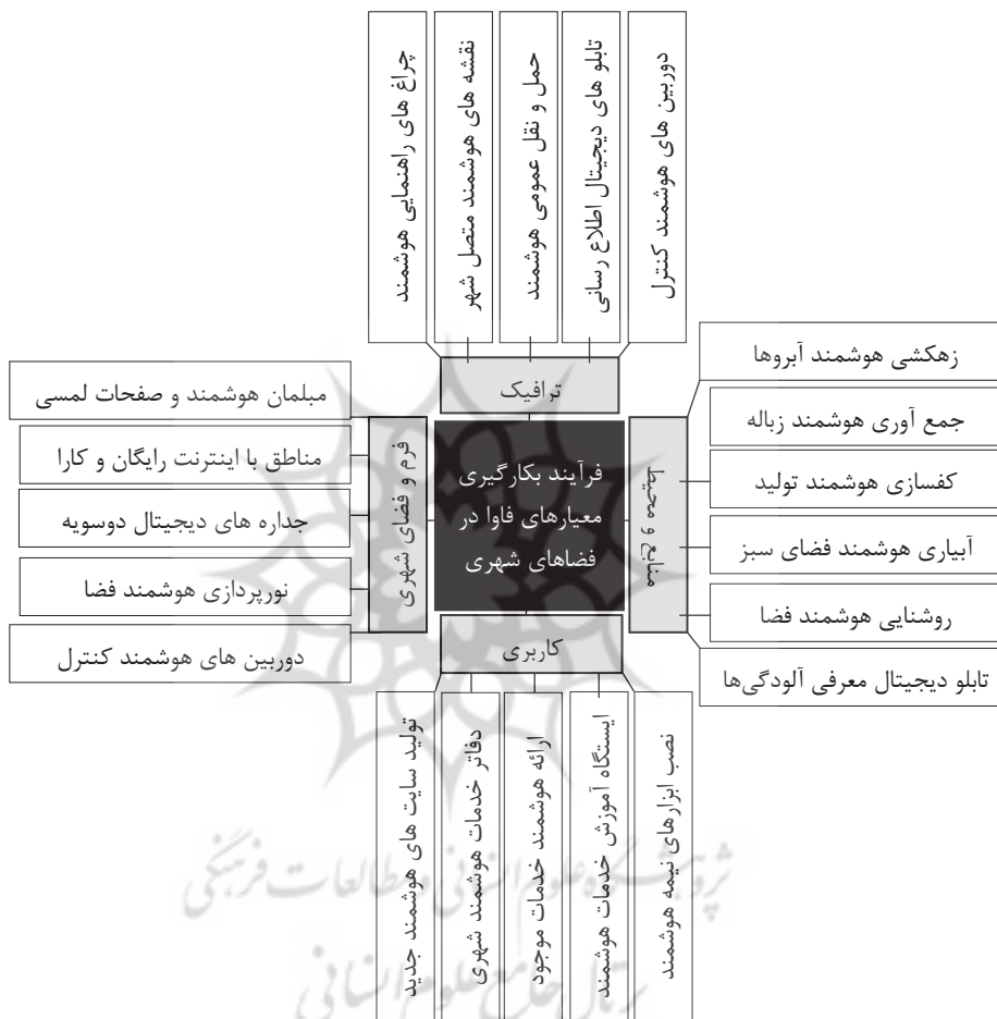
تصویر ۲ - مدل مفهومی پژوهش: معیارها و شاخص‌ها

برخورد با آینده‌نگرانی مهم بشر امروز می‌باشد که در فضای فاوا به بلوغ می‌رسد. این فناوری حتی سنتی‌ترین ویژگی‌های زندگی انسان مثل تعاملات اجتماعی را در خود جای داده است (مویدفر و ضرابی، ۱۳۹۳: ۴۱۰). کاربرد فاوا در آینده شهرها با مشکلات گوناگونی روبرو است. برای مثال، از بعد فنی چالش‌های استانداردسازی، افزایش دقت، صحت و یکپارچگی اطلاعات متنوع در درازمدت وجود دارد و در بعد مشارکت اجتماعی، صلاحیت و پذیرش کارآمد عموم مردم و کارشناسان مد نظر است (green, 2011: 2, 17). فضاهای شهری باید بتوانند با ساکنان خود تعامل کنند و فاوا این مسیر را تسهیل می‌کند. برآیند نظریات فوق، گویای ابعاد مختلف فرایند بکارگیری معیارهای فاوا در فضاهای شهری بویژه پیاده‌راه است، که می‌تواند پشتوانه محکمی برای ورود شهرسازان به چالشی اثرگذار بر کارایی و پایداری شهرها باشد. در همین راستا مدل مفهومی پژوهش مطابق شکل (۲) تنظیم شد.