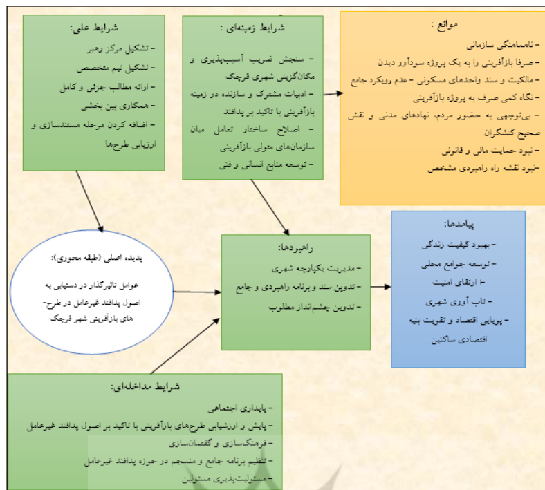
شکل ۲. الگوی کدگذاری (مدل پارادایمیک) تئوری داده بنیاد