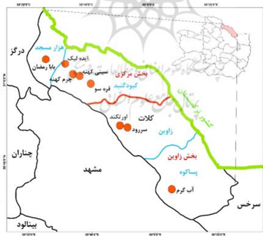
شکل ۲. نقشه موقعیت روستاهای نمونه در شهرستان کلات استان خراسان رضوی

محدوده مورد مطالعه شهرستان کلات نادری در استان خراسان رضوی است. این شهرستان دارای ۲ بخش مرکزی و زاوین و ۴ دهستان پساکوه، زاوین، کیود گنبد و هزار مسجد است. مطابق شکل (۲)، ۸ روستای مقصد گردشگری مورد مطالعه در ۴ دهستان این شهرستان پراکنده می‌باشند.