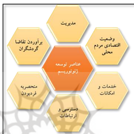
شکل ۱. عناصر اصلی اثرگذار بر توسعه ژئوتوریسم در مقاصد از دیدگاه گنتینگ و فبری.

پایدار جوامع محلی خواهد بود (Wéber et al, 2015:318). روچا و سیلوا (۲۰۱۴)، بیان می‌کنند؛ زمانی که از توسعه ژئوتوریسم، سخن گفته می‌شود؛ یکی از محورهای اصلی آن ارزش‌های طبیعی و جاذبه‌های آن بوده و محور بعدی آن، مرتبط با مطلوبیت وضعیت مدیریت، خدمات و امکانات، پشتیبانی مالی، ارائه بسته‌های متنوع به ژئوتوریست‌ها، سازماندهی و ارتباطات گروه‌ها و بازیگران درگیر، رضایت گردشگران، وضعیت حفاظت، بهره‌مندی اقتصادی جامعه محلی، ارتباط مردم محلی با ژئوتوریست‌ها و پذیرش آنها خواهد بود (Rocha and Silva, 2014:744). گنتینگ و فبری (۲۰۱۸) نیز، لازمه موفقیت و اثرگذاری ژئوتوریسم را در مطلوبیت عناصر اثرگذار آورده شده در شکل زیر می‌دانند (Ginting and Febri, 2018:2).