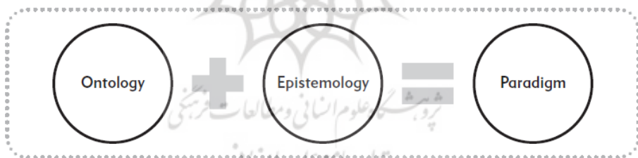
شکل شماره ۱: اجرای پارادایم های پژوهشی (مرادی و میرالماسی، ۲۰۲۰)

محقق در پژوهش حاضر از نقطه نظر هستی شناسی و معرفت شناسی پژوهش را در دسته پارادایم های برساختی و تفسیری قرار می دهد (شکل شماره ۱) و به تبع آن رویکردی کیفی را برای استدلالی استقرایی گونه در جهت حل مسئله بکار می بندد. (شکل شماره ۲).