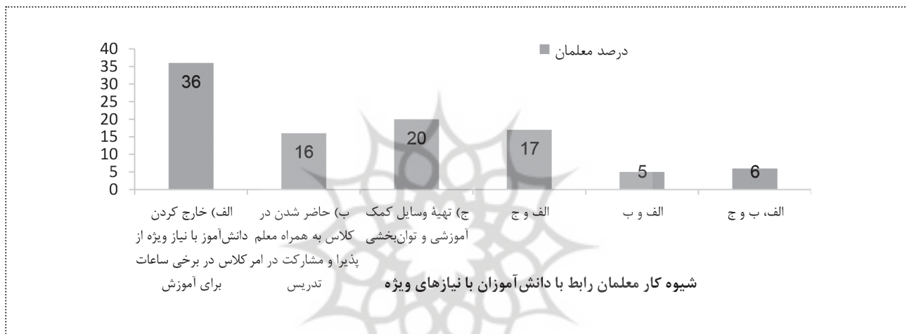
نمودار (۲) اتخاذ ۳ شیوه کار کردن معلم رابط با دانش‌آموز با نیازهای ویژه از نظر معلمان رابط و پذیرا

با توجه به نمودار (۱) در نمونه مورد بررسی از نظر معلمان ۳۳ درصد این دانش‌آموزان به خدمات گفتاردرمانی نیاز داشتند که تنها ۸ درصد آنها به آن دسترسی دارند بعلاوه اینکه ۶۳ درصد دانش‌آموزان با نیازهای ویژه به خدمات روان‌شناسی و مشاوره نیاز داشتند که ۲۹ درصد آنها به آن دسترسی دارند، همچنین ۴۶ درصد این گروه از دانش‌آموزان نیازمند خدمات کاردرمانی بودند که تنها ۳ درصد آنها به آن دسترسی دارند و ۴۳ درصد دانش‌آموزان با نیازهای ویژه به سایر خدمات حمایتی نیازمند بودند که تنها ۴ درصد آنها به این خدمات دسترسی دارند. همچنین از نظر معلمان پذیرا ۵۰ درصد دانش‌آموزان با نیازهای ویژه نیازمند معلم رابط بودند ولی تنها ۱۹ درصد آنها به معلم