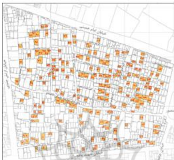
شکل ۲. واحدهای مسکونی کمتر از ۱۰ سال ساخت در محدوده‌ی منتخب پژوهش (بخشی از محله باغشمال تبریز)

نقشه‌های تفصیلی شهر تبریز نمونه‌های مذکور در نقشه‌ی آن محدوده شناسایی و کدگذاری شدند. مجموع نمونه‌های قابل دسترسی ۱۹۳ واحد می‌باشد و در شکل ۲ معین شده‌اند.