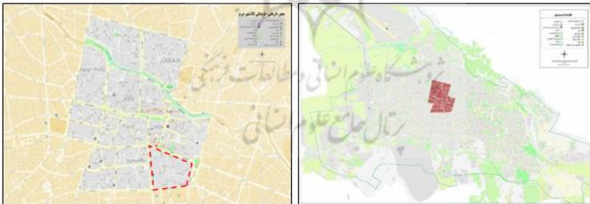
شکل ۱. راست: محدوده‌ی تاریخی- فرهنگی تبریز؛ چپ: موقعیت محدوده‌ی منتخب (بخشی از محله باغشمال تبریز) در محور تاریخی- فرهنگی