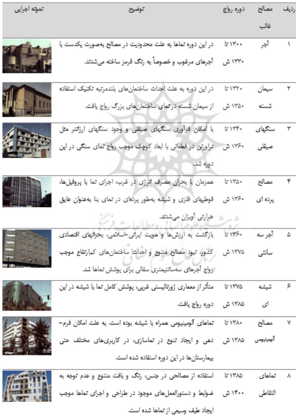
جدول ۲. دسته‌بندی مصالح و روش‌های نماسازی در طول یک قرن گذشته در ایران

می‌توان ادعا کرد که روش‌های ساختمانی به‌طور غالب به اسکلت‌های فولادی و بتنی محدود شد، لیکن فرم‌های ظاهری و نماها همزمان با تحولات و نوآوری در روش‌ها و مصالح ساختمانی در کشورهای توسعه یافته، دستخوش تغییر و تحول شده است. با بررسی ساختمان‌های مختلف با قدمت‌های گوناگون می‌توان تغییر و تحول نماسازی را به دسته‌های مختلف تقسیم‌بندی کرد و تأثیرپذیری نماها را در هر دوره از مصالح و روش‌های رایج روز استنتاج نمود (جدول ۲). [۱۸]