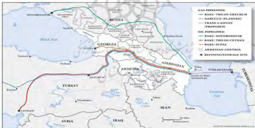
نقشه-خطوط انتقال انرژی BTC و SUPSA و موقعیت معبری گرجستان.

✱ خط لوله نفتی «باکو-تفلیس-جیحان» (SUPSA): مهمترین بخش راهروی شرق-غرب برای انتقال نفت، خط لوله باکو-تفلیس-جیحان است که نفت را از میدان نفتی «ای سی جی» جمهوری آذربایجان و از طریق خاک گرجستان به پایانه‌ای در ساحل جیحان ترکیه منتقل می‌کند. گرچه این خط لوله در ابتدا برای انتقال نفت از کشور آذربایجان طراحی شد؛ اما این ظرفیت را دارد که نفت سایر کشورهای حوزه دریای خزر به‌ویژه قزاقستان را نیز انتقال و به ظرفیت انتقال ۸۰ میلیون تن نفت خام در سال به ترکیه دست یابد. (گوچیتاشوبلی، ۲۰۲۰: ۳۳۶).