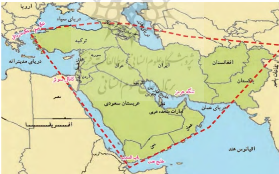
نقشه-موقعیت جغرافیایی و ژئوپلیتیکی جنوب غرب آسیا

آسیای جنوب غربی به عنوان یک حوزه جغرافیای وسیع به کار برده می‌شود که چندین منطقه مشهور را که در مطالعات منطقه‌ای به مثابه مناطق جداگانه محسوب میشوند، در خود جای میدهد شامل بخشهایی از منطقه قفقاز، قسمتی از شبه قاره هند، آسیای مرکزی، آسیای صغیر و شامات و مصر در شمال شرق آفریقا. این بخش از جهان ۱۹ کشور مستقل را شامل می‌شود که عبارتند از ایران، ترکیه، سوریه، عراق، اردن، لبنان، فلسطین اشغالی، عربستان، یمن، عمان، امارات متحده عربی، قطر، بحرین، کویت، پاکستان، افغانستان، آذربایجان، ارمنستان و گرجستان. (یعقوبی و دیگران، ۱۳۹۸: ۸۱).