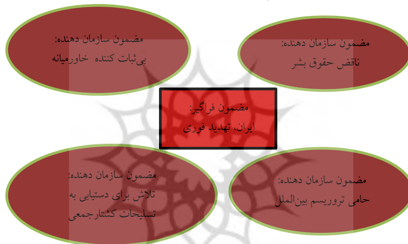
شکل ۲) مضمون فراگیر و مضامین سازمان دهنده علیه ایران

(۲) ایران بی‌ثبات کننده خاورمیانه؛ (۳) ایران، حامی تروریسم بین‌المللی و (۴) ایران به دنبال دستیابی به سلاح‌های کشتار جمعی. مضمون فراگیر در شبکه مضامین، امنیتی کردن ایران با القای تهدید فوری بودن ایران و لزوم مقابله و برخورد اضطراری با این کشور بوده است.