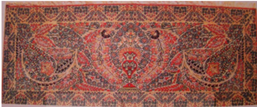
تصویر ۵. نمونه قالیچه متناسب به راور (شاهکارهای فرشبافی ایران، ۱۳۵۲)

سفرنامه خراسان و کرمان در سال ۱۳۲۱ ه ق / ۱۹۰۴ م می گوید: «قالیاف بسیار در راور هست که قالی اعلا تمام می نمایند و الحق بعد از گواشیر در جای دیگر به این خوبی قالی نمی یافتند (کاربخش راوری، ۱۳۷۵: ۱۹۹). (تصویر ۵).