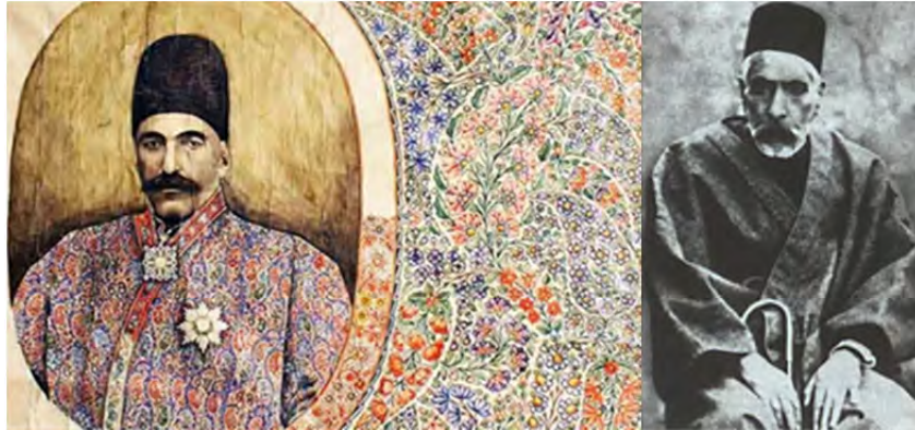
تصویر ۳. (سمت راست) حسن خان شاهرخی (ژوله، ۱۳۹۲)