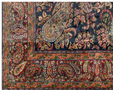
تصویر ۲. بخشی از قالی کرمان با نقوش ترمه (حشمتی رضوی، ۱۳۹۲)