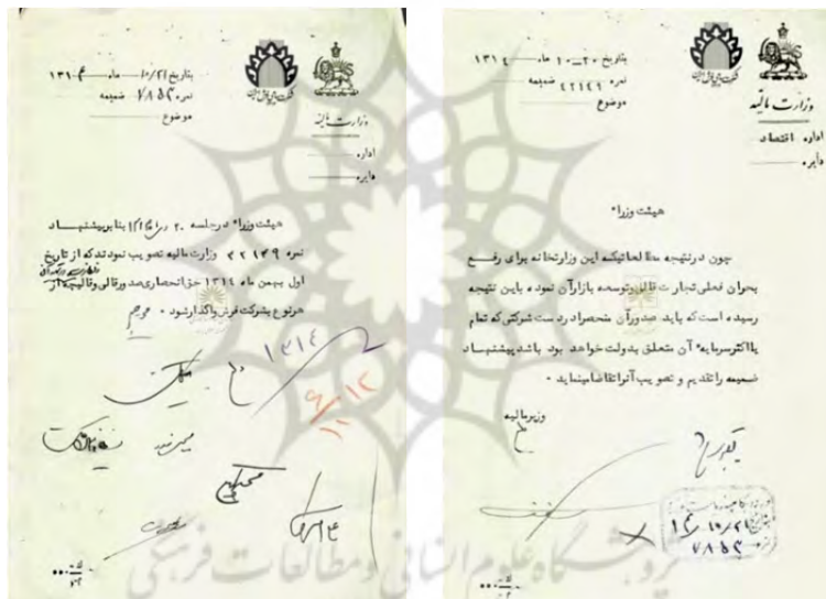
تصویر ۱۲. (سمت راست) پیشنهاد وزارت مالیه مبنی بر واگذاری صدور فرش به شرکتی دولتی

هیئت وزرا در جلسه ۲۰ دی‌ماه ۱۳۱۴ بنا بر پیشنهاد نمره ۴۲۱۴۹ وزارت مالیه تصویب نمودند که از تاریخ اول بهمن‌ماه ۱۳۱۴ حق انحصاری صدور قالی و قالیچه و نظارت در تهیه آن از هر نوع به شرکت فرش واگذار شود.