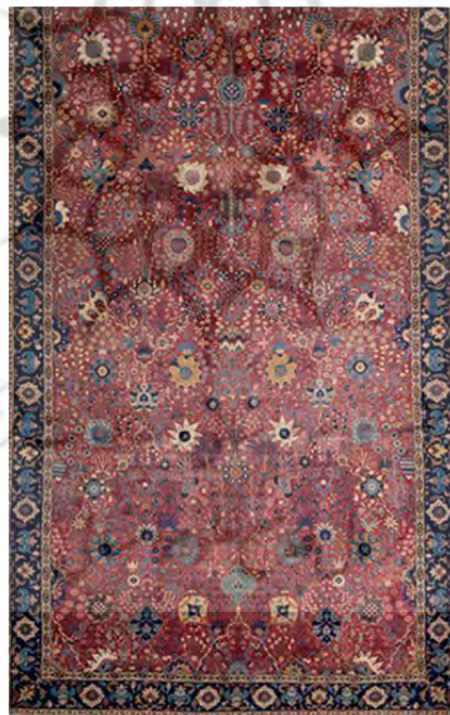
تصویر ۱. قالی بافت کرمان با طرح گلدانی مربوط به دوره صفوی (شاهکارهای فرش بافی ایران، ۱۳۵۲)

در مورد قدمت قالیبافی در منطقه کرمان نظرات گوناگون و گاه متناقضی ارائه شده است. سیسیل ادواردز (A.C. Edwards) با استناد به گزارش‌های درباری و نیز نوشته‌های تاریخی، قدمت تولید قالی در این منطقه را تا حدود قرن شانزدهم میلادی تخمین می‌زند؛ اما در طرف مقابل عده‌ای از صاحب‌نظران بر این عقیده‌اند که اگر چه قدیمی‌ترین نمونه‌های باقیمانده از قالی کرمان متعلق به قرن شانزدهم میلادی است، اما بدون تردید فرش کرمان به جهت استواری طرح‌های قدیم آن و پایداری به برخی سنت‌های قدیمی فرش ایران، دارای سابقه طولانی‌تری است (صوراسرافیل و ژوله، ۱۳۷۸: ۳۴). آنها همچنین تکنیک‌های بافت در منطقه کرمان را از تکنیک‌های بسیار کهن قالیبافی ایران می‌دانند که در دیگر مناطق (شهری) کشور کمتر به کار رفته است (ژوله، ۱۳۸۱: ۱۶۳).