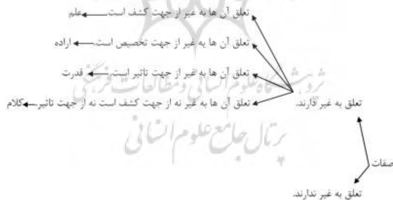
نمودار شماره ۱: صفات متعلق به غیر

صفت حیات یک صفت ثبوتی است که در آن، هیچ‌گونه اضافه و نسبت تحقق ندارد. البته صفت وجوب و حق را نیز می‌توان از همین قبیل صفات بشمار آورد (ر.ک؛ الغزالی، ۱۳۱۶: ۱۰۱) غزالی همچنین بیان می‌کند که بین صفات حقیقیه ذات اضافه و صفات اضافی محض، تفاوت قائل نشده است ولی درباره صفاتی که نوعی تعلق به غیر دارند، به یک تقسیم‌بندی خاص مبادرت ورزیده است. وی می‌گوید: صفاتی که در آن‌ها نوعی تعلق به غیر تحقق دارد، به چهار دسته تقسیم می‌شوند: دسته اول صفاتی قرار دارند که تعلق آن‌ها به غیر، از جهت کشف است مانند علم و سمع و بصر. دسته دوم صفاتی قرار دارند که تعلق آن‌ها به غیر، از جهت تخصیص است مانند اراده. دسته سوم صفاتی را باید نام برد که تعلق آن‌ها به غیر از جهت تأثیر است مانند صفت قدرت. بالاخره دسته چهارم صفاتی را می‌توان نام برد که تعلق آن‌ها به غیر، نه از جهت کشف است و نه از جهت تأثیر مانند کلام (ر.ک؛ ابراهیمی دینانی، ۱۳۹۰: ۲۸۲-۲۸۳).