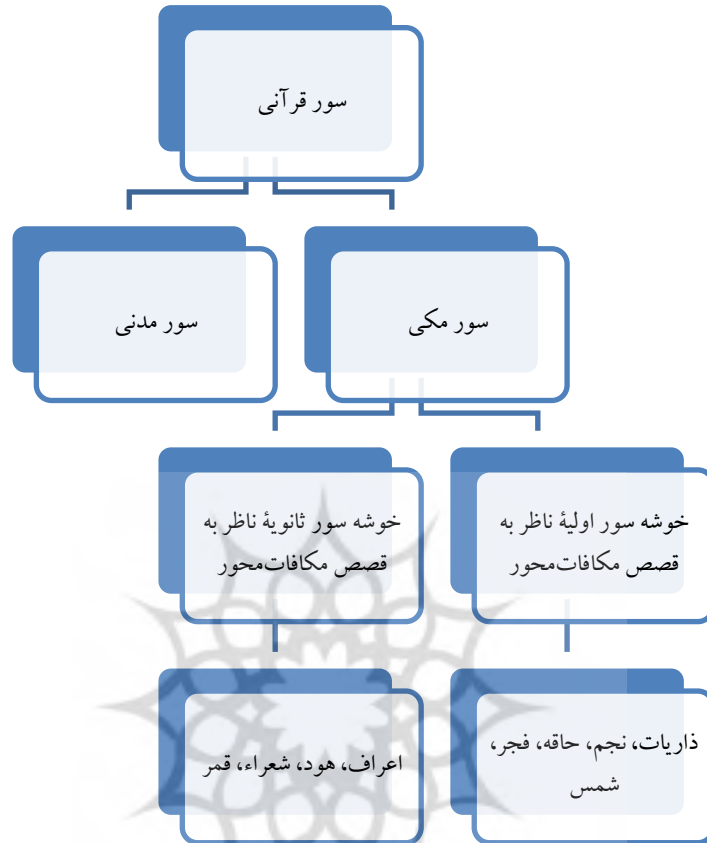
نمودار ۲. آمار سوره‌ها در هر خوشه سوره

نکته آخر اینکه، چون داستان یونس را داستانی می‌دانیم که در پایان به داستان رحمت بدل می‌شود، آن را جزء فهرست قصص مکافات محور خمسه قرار نداده‌ایم، با این حال، جداگانه بررسی خواهد شد. حال، پرسش اینجاست که ویژگی‌های خصیصه‌نمای قصص مکافات محور خمسه چیست؟ به باور مارشال (۲۰۰۰: ۳۱۹) این داستان‌ها، «از حیث شکل و محتوا، شباهت‌های بسیار به هم دارند و با شماری عبارات تکرارشونده به هم پیوند یافته‌اند». طبق سخن او، این پنج داستان، با واکنش کفرآمیز قوم و مردمی خاص نسبت به پیامبر خدا که نوعاً از همان قوم و قبیله انتخاب شده، با فعل «کذَّبَتْ» آغاز می‌شود که به انکار دعوت پیامبران الهی از جانب کافران، اشاره می‌کند. پس از این مقدمه، دعوت مردم