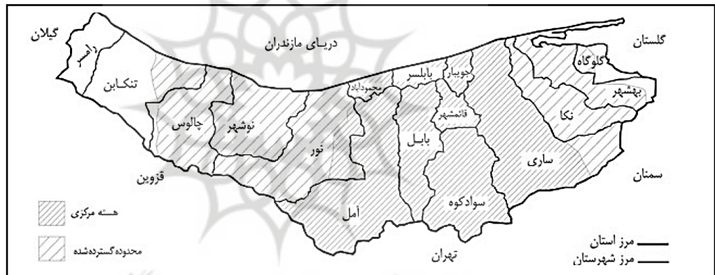
Map 1. The territory of the Marashian government during their period of power in the Tabaristan region. According to today's political divisions (Memarian & Pirzad, 2011: 43). Era (Authors, 2021).

نقشه ۲. محدوده قرارگیری سقانفارها در منطقه مازندران با سه حوزه آمل، بابل و ساری (معماریان و پیرزاد، ۱۳۹۱: ۴۳).