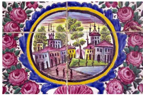
تصویر ۱۵. منظره، مسجد نصیرالملک، فارس (یوزباشی، ۱۴۰۰).