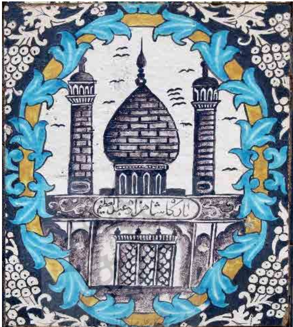
تصویر ۷. نقوش مذهبی (بارگاه شاهزاده عبدالعظیم)، بخش حسینیه، تکیه معاون‌الملک، کرمانشاه (یوزباشی، ۱۳۹۹).