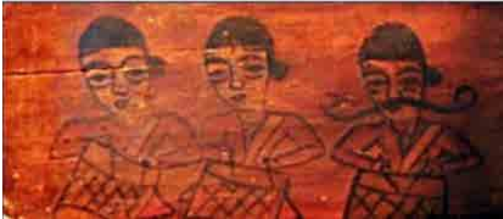
تصویر ۱۰. جنگجویان، سقانفار کیجا، بابل، مازندران (یوزباشی، ۱۴۰۰). Fig. 10. Warriors, Saqanfar Kija, Babylon.Mazandaran (Youzbashi, 2021).

این آثار و امکان تهیه آن‌ها با هزینه اندک، در گسترش هرچه سریع‌تر این فرهنگ مؤثر بوده است. تصاویری با موضوعات تخیلی و انتزاعی در اماکن مذهبی چون سقانفارهای مازندران دیده شده است. از آنجا که مازندران مرکز حکومت در زمان ظهور کتاب‌های چاپ‌سنگی در ایران بوده است، تأثیر تصاویر آن بر دیوارنگاره‌های اماکن مذهبی به‌وفور دیده شده است؛ به‌طور مثال، نسخهٔ عجایب‌المخلوقات و غرایب‌الموجودات، ۱۲۶۴ ه.ق. ترجمهٔ فارسی از متن عربی نوشتهٔ «محمد بن زکریا القزوینی» با تصاویری از «میرزا علیقلی خویی» است. تصاویر موجودات ماورائی و افسانه‌ای، اعم از: حیوانات، گیاهان یا موجودات ترکیبی در آن دیده می‌شوند. از عجایب خشکی تا عجایب بهر، صور فلکی و کواکب همه و همه، از گستردگی به‌میزان بالا در تعداد کل نقوش را دارند. بسیاری از این موجودات عجیب عیناً و بدون تغییر در این مکان‌ها به تصویر کشیده شده‌اند، اما تعدادی از آن‌ها تغییراتی ایجاد شده و فرم‌های جدیدی به خود گرفته‌اند که با عجایب موجود در کتاب عجایب‌المخلوقات تفاوت‌هایی دارند. این تغییرات به‌سبب وجود دانش و اطلاعات شفاهی است که به مرور ایام در ذهن نقاش نقش‌بسته و سپس بر فضای این بناهای مذهبی نشستند. اغلب این نقوش در ارتباط با دیو و اهریمن و یا جنیان و پریان است که منشأ آن، اعتقادات مردم منطقه