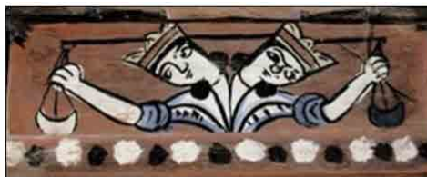
تصویر ۱. سنجش اعمال، سقانفار شیاده، مازندران، بابل، روستای شیاده (رستمی و باباجان تبار، ۱۳۹۳: ۱۰۱).