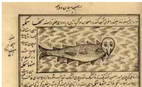
تصویر ۱۳. نقش مایه بدن ماهی با سر پرنده، عجایب‌المخلوقات، سقانفار شرمه‌کلا، بابلسر، مازندران (محمودی، ۱۳۹۰، ۲۳۷).

Fig. 14. Fish-body-bird-head pattern, Book of Wonders-Al-Makhluqat, (https://kotob.blogsky.com/1394/03/30).