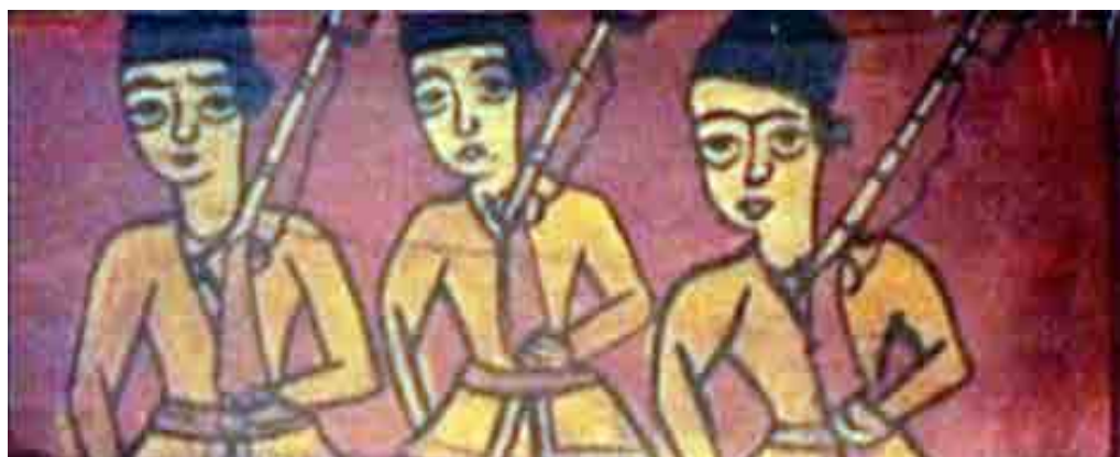
تصویر ۸. اسلحه، سقانفار کیجا، بابل، مازندران (یوزباشی، ۱۴۰۰).