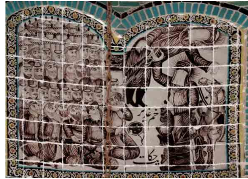
تصویر ۳. غدیر خم، بخش زینبیه، تکیه معاون الملک، کرمانشاه (یوزباشی، ۱۳۹۹).