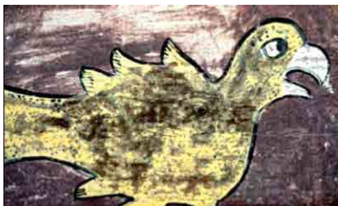
تصویر ۱۴. نقش مایه بدن ماهی با سر پرنده، کتاب عجایب‌المخلوقات (https://kotob.blogsky.com/1394/03/30)

می‌باشند (محمودی، ۱۳۹۰: ۲۳۳). نقش مایه بدن ماهی با سر پرنده (تصویر ۱۳ و ۱۴) و نقش مایه بدن ماهی با سر انسان نمونه‌های الهام‌گرفته شده از کتاب عجایب‌المخلوقات هستند.