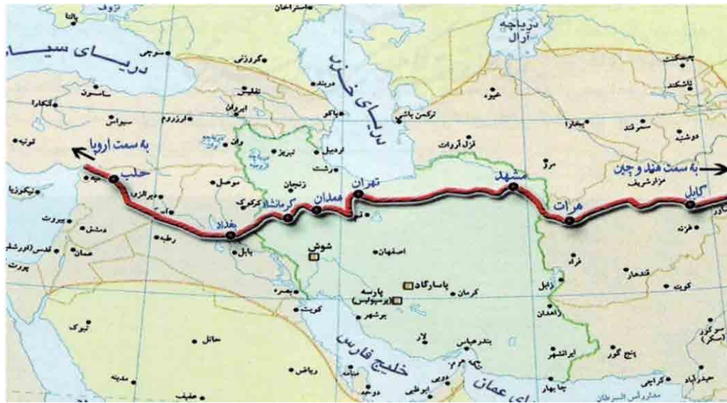
نقشه ۳. مسیر جاده ابریشم و گذر آن از شهرهایی چون: مشهد، تهران، همدان و کرمانشاه ( https://lahzeakhar.com/Tourist-attractions-full-information/24977 ).