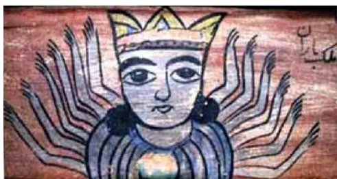
تصویر ۲. ملک باران، سقانفار رمنت، مازندران، بابلسر، روستای رمنت (محمودی، ۱۳۹۰: ۱۵۶).