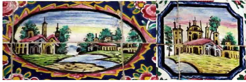
تصویر ۱۶. منظره، مسجد نصیرالملک، فارس (یوزباشی، ۱۴۰۰).