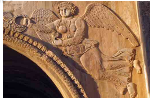
تصویر ۱۱. نقش برجسته فرشته بال‌دار. تاق‌بستان، کرمانشاه ( https://iranbia.com/tag/persia ). Fig. 11. Winged angel relief. Taqobstan, Kermanshah ( https://iranbia.com/tag/persia ).