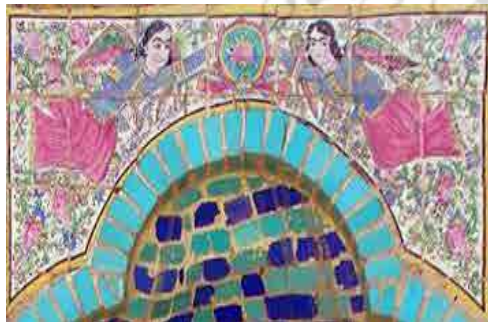
تصویر ۱۲. کاشی نگاره فرشته بال‌دار، تکیه معاون‌الملک، کرمانشاه (یوزباشی، ۱۳۹۹). Fig. 12. Winged angel tile painting, Tekiye Moaven-Al Molk, Kermanshah (Youzbashi, 2019).

این آثار و امکان تهیه آن‌ها با هزینه اندک، در گسترش هرچه سریع‌تر این فرهنگ مؤثر بوده است. تصاویری با موضوعات تخیلی و انتزاعی در اماکن مذهبی چون سقانفارهای مازندران دیده شده است. از آنجا که مازندران مرکز حکومت در زمان ظهور کتاب‌های چاپ‌سنگی در ایران بوده است، تأثیر تصاویر آن بر دیوارنگاره‌های اماکن مذهبی به‌وفور دیده شده است؛ به‌طور مثال، نسخهٔ عجایب‌المخلوقات و غرایب‌الموجودات، ۱۲۶۴ ه.ق. ترجمهٔ فارسی از متن عربی نوشتهٔ «محمد بن زکریا القزوینی» با تصاویری از «میرزا علیقلی خویی» است. تصاویر موجودات ماورائی و افسانه‌ای، اعم از: حیوانات، گیاهان یا موجودات ترکیبی در آن دیده می‌شوند. از عجایب خشکی تا عجایب بهر، صور فلکی و کواکب همه و همه، از گستردگی به‌میزان بالا در تعداد کل نقوش را دارند. بسیاری از این موجودات عجیب عیناً و بدون تغییر در این مکان‌ها به تصویر کشیده شده‌اند، اما تعدادی از آن‌ها تغییراتی ایجاد شده و فرم‌های جدیدی به خود گرفته‌اند که با عجایب موجود در کتاب عجایب‌المخلوقات تفاوت‌هایی دارند. این تغییرات به‌سبب وجود دانش و اطلاعات شفاهی است که به مرور ایام در ذهن نقاش نقش‌بسته و سپس بر فضای این بناهای مذهبی نشستند. اغلب این نقوش در ارتباط با دیو و اهریمن و یا جنیان و پریان است که منشأ آن، اعتقادات مردم منطقه