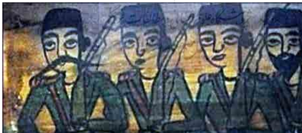
تصویر ۹. جنگجویان، سقانفار کیجا، بابل، مازندران (یوزباشی، ۱۴۰۰).

توجه و اهمیت به عنوان خاستگاه‌های هنر ایران باستان (هخامنشی و ساسانی) رویکردی بود که به طور خاص از زمان «فتحعلی شاه» آغاز شد و هنرمندان دیوارنگاره‌ها در آثارشان از تصاویر موضوعات هنر ایران باستان استفاده می‌کردند. اغلب نقوش برجسته قاجار متأثر از آثار ساسانی و حتی در همان مکان‌ها شکل گرفته‌اند؛ به طور مثال، چند کاشی‌نگاره با نقش فرشته بال‌دار (نیکه) در «تکیه معاون‌الملک» در کرمانشاه قرار دارد که متأثر از نقش برجسته فرشته بال‌دار از نقوش ساسانی تاق‌بستان است و تکیه معاون‌الملک در نزدیکی این مکان قرار دارد.