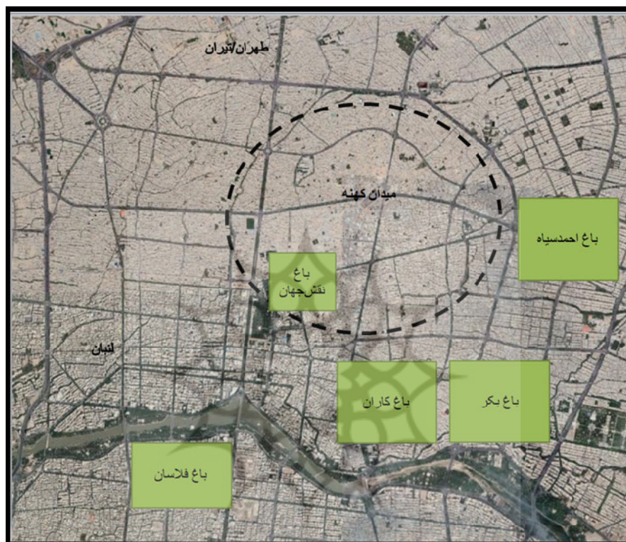
نقشه ۲: نقشه شهر اصفهان و باغ‌های سلطنتی آن در دوره سلجوقی بر روی نقشه اصفهان امروز

نام یکی از بزرگان ۱ اصفهان که پسوند کوشکی داشته، حداقل تا قرن سوم هجری قابل پیگیری است. بر این اساس دوره ساخت این باغ به قبل از دوره سلجوقی می‌رسد.